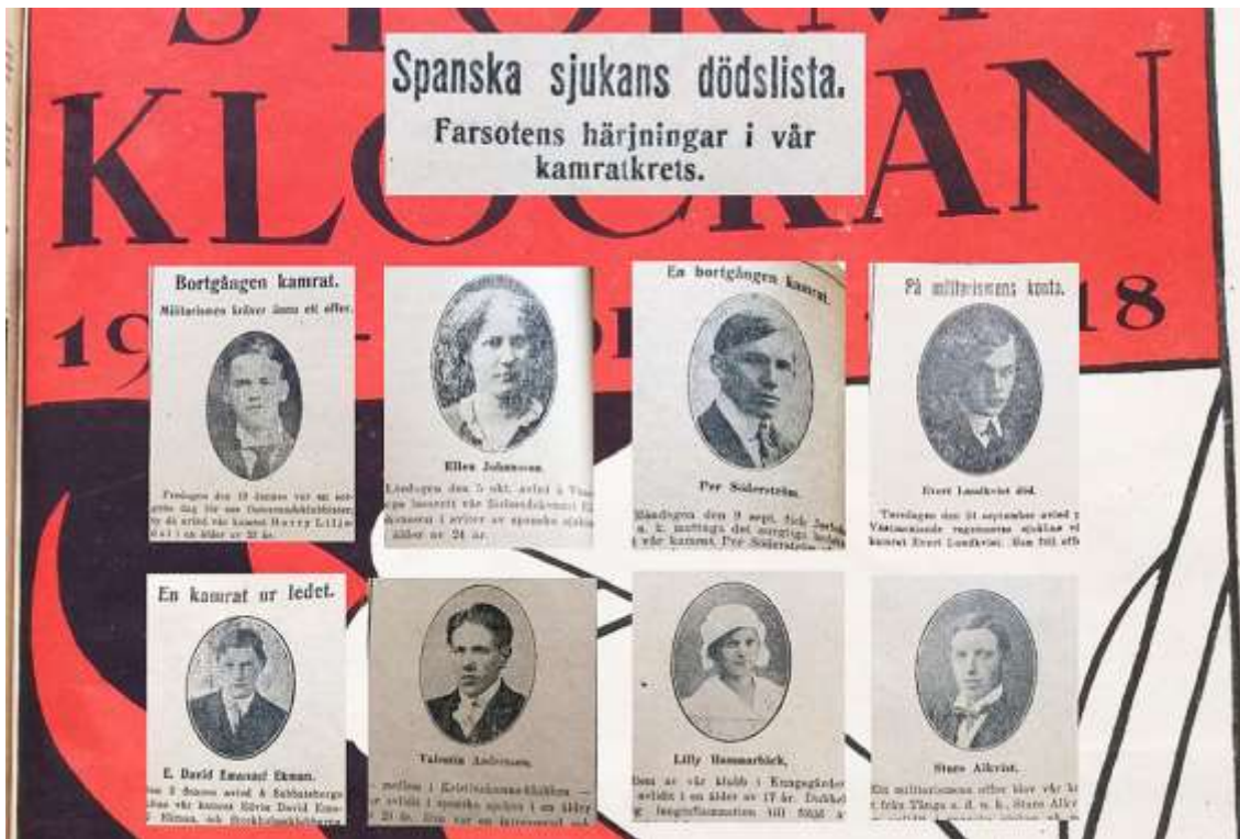
Socialistungdomen drabbades hårt av spanska sjukan 1918-20

Vad som skulle utvecklas till den mest dödliga pandemin sedan digerdöden på 1300-talet hade länge mörkats av krigscensuren. Utom i Spanien som stod utanför världskriget. En aggressiv influensa mitt under sommaren var ovanligt. Men att influensor krävde offer var ingenting nytt. ”Ryska snuvan” eller ”Petersburgsinfluensan” vintern 1889-90 med hosta, huvudvärk, feber och ”mattighet” hade varit särskilt allvarlig, även i Sverige. ”Den har inträngt i hemmen, i kasernerna, på verkstäderna, i fabrikena, kort sagt överallt”, rapporterade Dagens Nyheter i december från Stockholm. Den ”ovälkomna julgåfvan” härjade på sjukhusen, hos brandkåren och andra yrkesgrupper och de smittades antal, bara i huvudstaden, kunde räknas i tusental, ”och hvarje dag kräver nya offer”. Det var bara några månader efter att det socialdemokratiska partiet grundats i Stockholm och farsoten räknades antagligen in som bara en av alla klassamhällets jävligheter av nöd och elände.