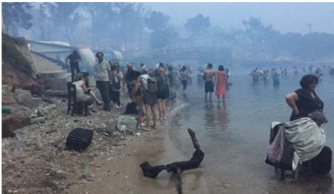
Bybor söker svalka i havet efter branden.

Det är inte första gången nedskärningar får allvarliga och dödliga konsekvenser. Tidigare har fackliga företrädare för vårdanställda i Grekland varnat för att nedskärningarna inom sjukvården ökat dödligheten bland patienterna.