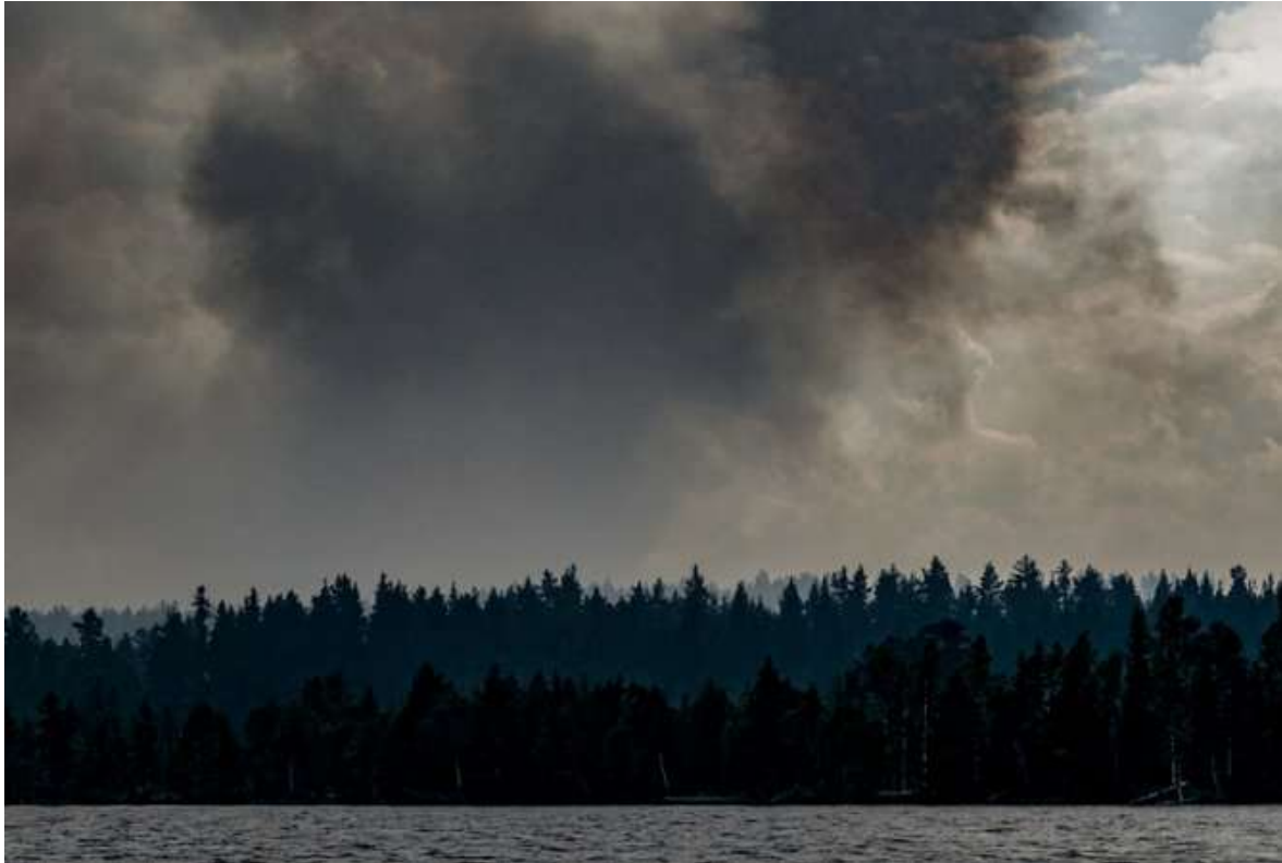
Klimatkrisisens förödande effekter gör sig allt mer påmind

dock inte naturlig. Ihållande torka innebär att bränder som borde släckas av de naturliga elementen, som regn, istället växer till jättebränder som nästintill blir ostoppbara. Ihållande värme och bristen på regn torkar ut marken långt ner i bergssedimenten och skapar ”torråska”, blixtnedslag som skapar nya bränder men utan det regn som brukar begränsa och slutligen släcka elden.