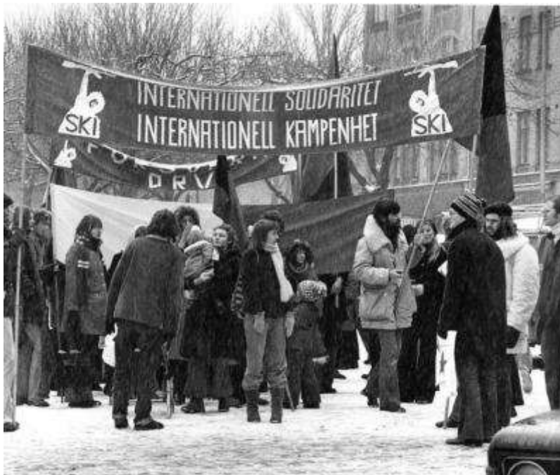
Demonstration i Lund mot Vietnamkriget. Radikaliseringen växte under hela 1960-talet och fick sitt kanske tydligaste uttryck i motståndet mot Vietnamkriget.

När jag själv började studera vid Umeå universitet och mycket snart gick med i den socialdemokratiska studentföreningen (USSF) var en av de första spektakulära aktionerna våren 1968 att bränna studentmössor som symboler för gammal överklasskultur, vilket påtagligt störde universitetsrektorns valborgsmässotal till våren om studenternas ljusnande framtid.