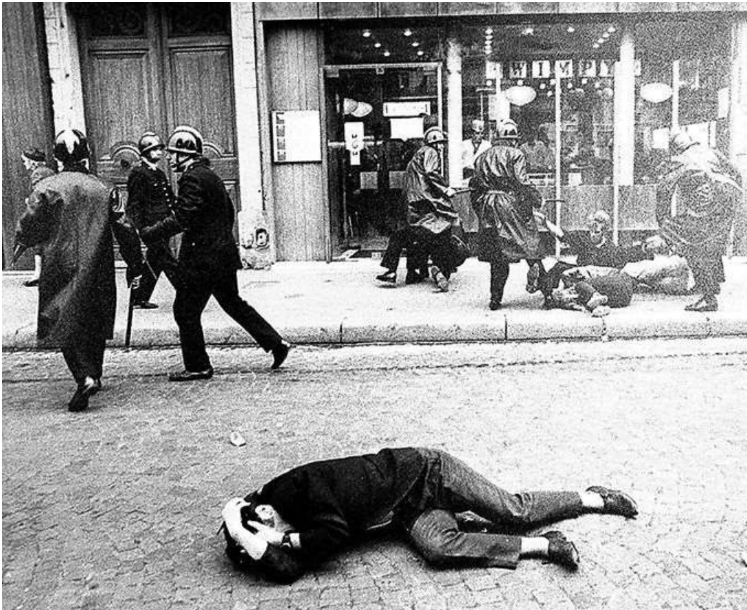
Kravallpolis går till attack mot demonstranter i Paris i maj 1968.

I sin bok May '68 and its afterlives diskuterar den amerikanska litteraturvetaren Kristin Ross vad som hänt med minnet av 1968.