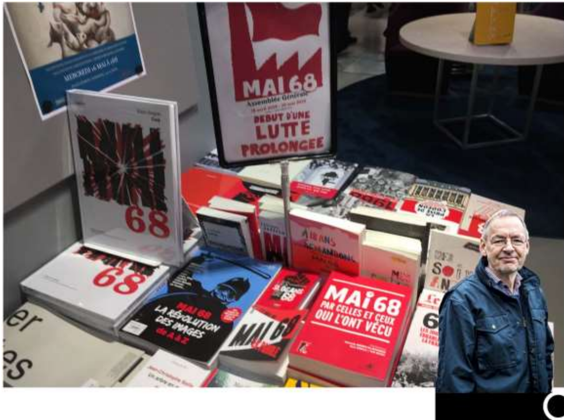
Bokhandel i Paris skyltar inför 1968-jubileet.

Några vackra vårdagar i Paris i början av maj 2018. De är naturligtvis färgade av femtioårsminnet av maj 68.