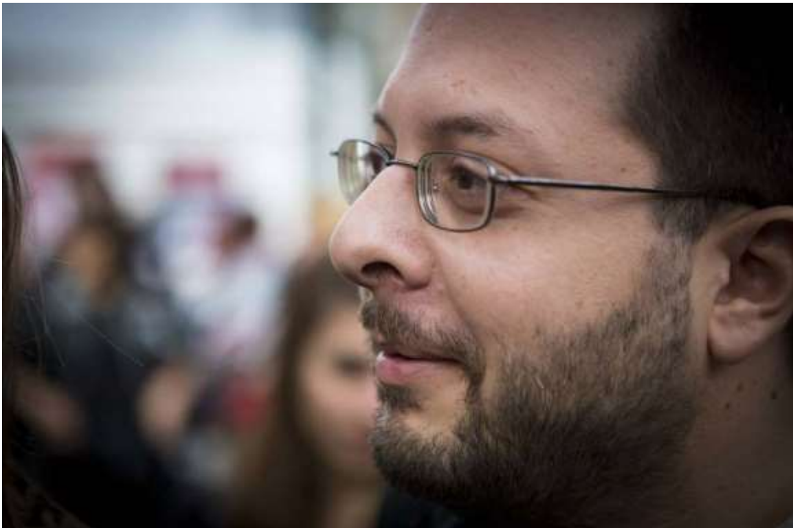
Dimoshtenis Papadathos från Syriza