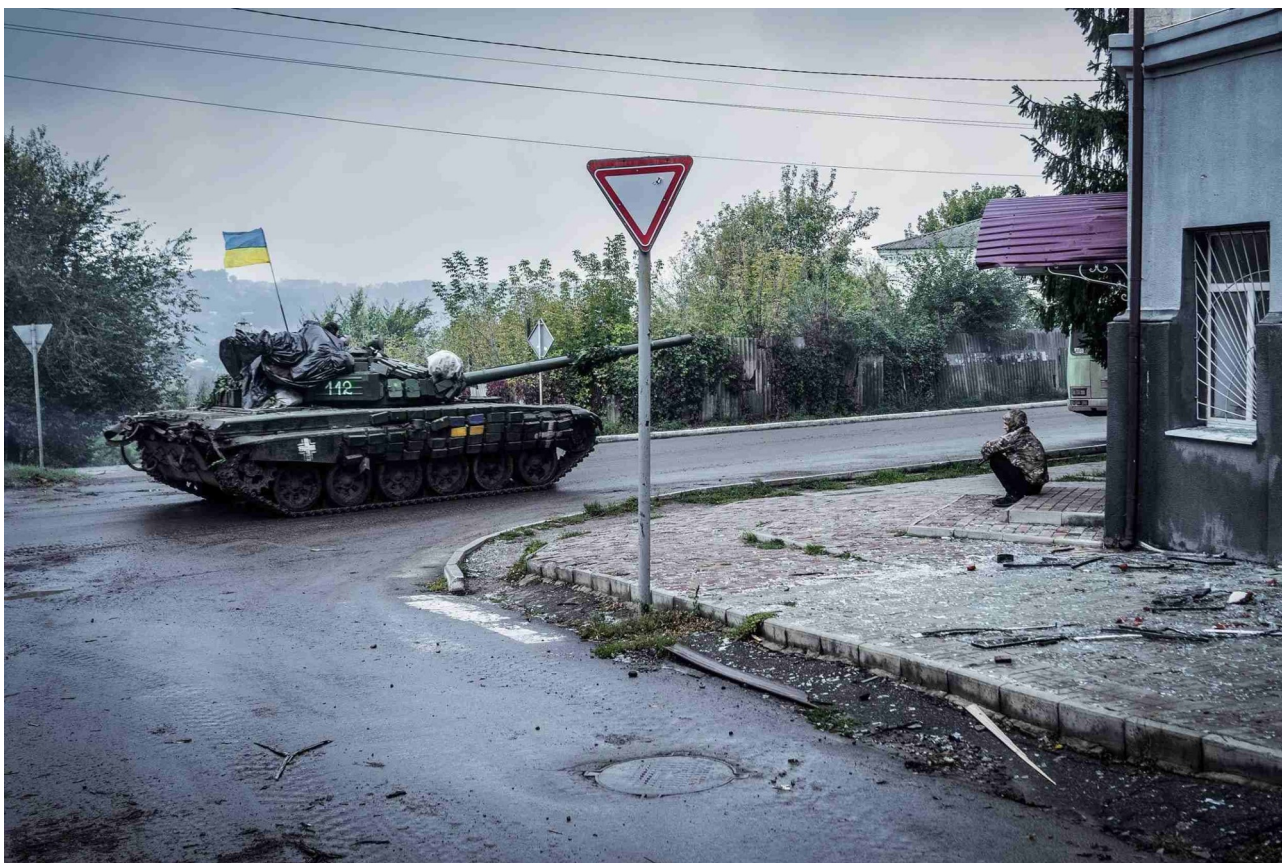
En ukrainsk stridsvagn kör nerför en av de centrala gatorna i Kupjansk, Charkivregionen, september 2022.

Jag har blivit mycket bättre på att känna solidaritet med opolitiska personer. De är överraskande starka. Jag upplevde stark ömsesidig hjälp, avvisande av auktoritarism och bejakande av humanism bland vanliga vapenbröder och -systrar vid fronten, som inte har så stor förståelse för radikala vänsterfunderingar. Jag kände och insåg att dessa personer har stor potential, att jag skulle vara med dem och att jag dessutom kan lära en hel del av dem.