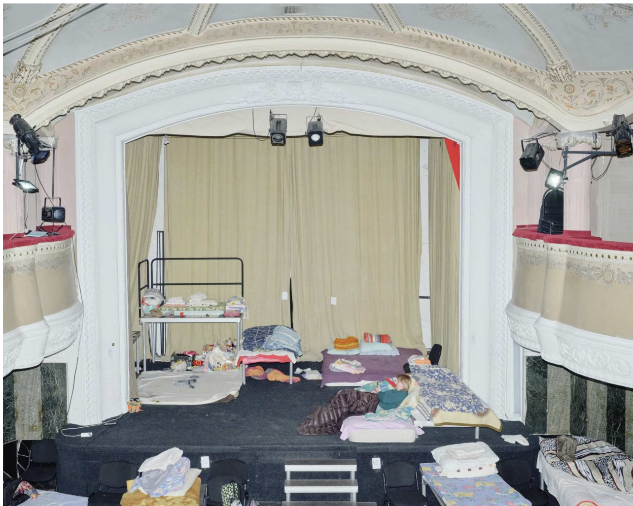
Utsikt från balkongen mot scenen på en teater som används som tillfällig logi för flyktingar, Lviv, mars 2022.

Jag skulle vilja se mer funderingar om Rysslands imperialistiska förflutna bland vänsteranhängare i väst. Tänk på koloniseringen av Sibirien. Tänk på massdeporteringarna, de politiska avrättningarna och förtrycket under de tsaristiska och sovjetiska regimerna. Kom ihåg de krig som Ryssland genomförde i Tjetjenien, Moldavien och Georgien. Kom ihåg Irpin, Butja. Kom ihåg massbegravningarna av civila, de källare för tortyr som de ryska trupperna systematiskt skapade i ukrainska byar och städer som ni inte känner till namnet på.