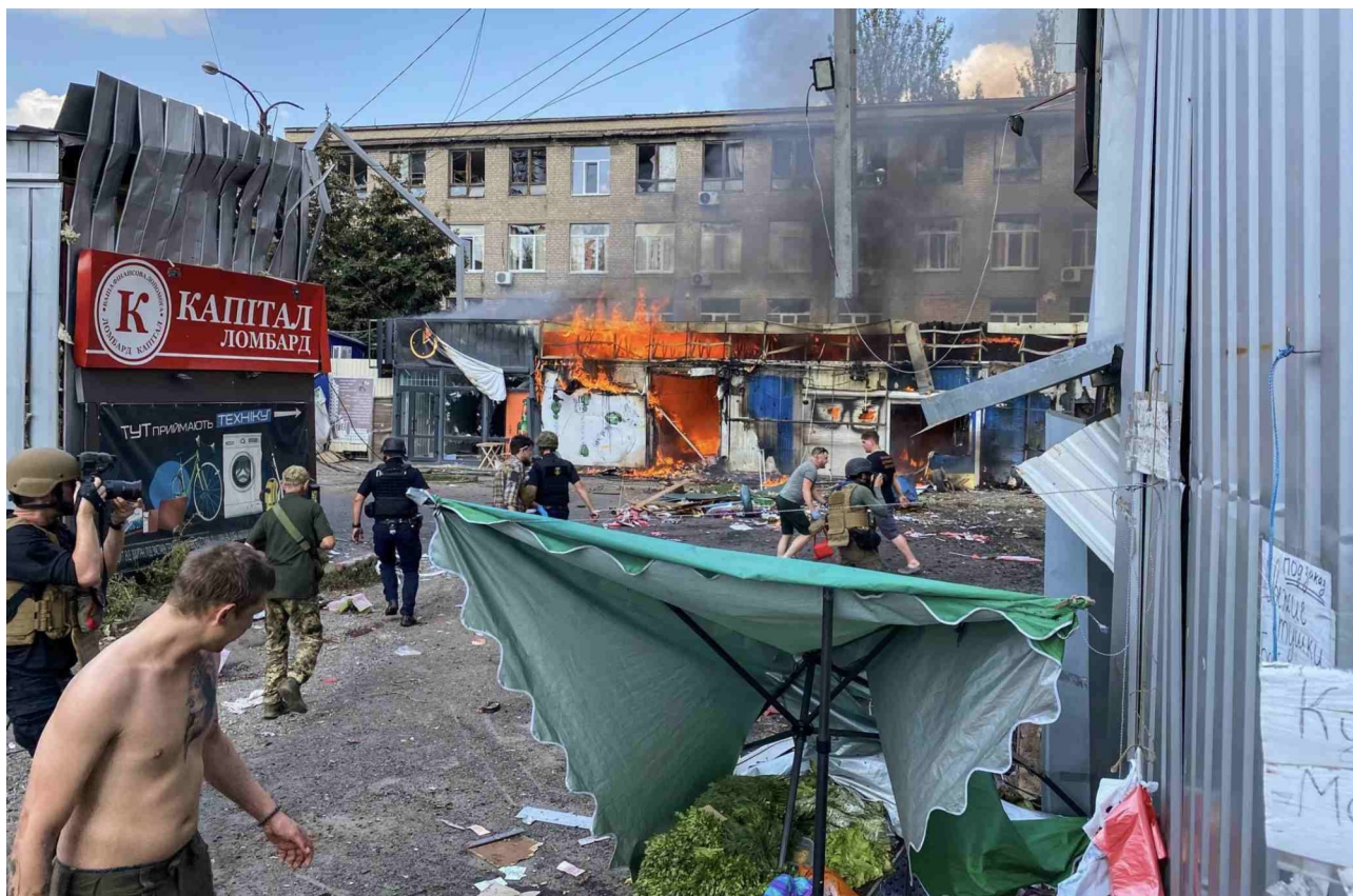
Brandbekämpning efter att en missil träffade marknaden i Kostiantynivka, Donetsregionen, 6 september 2023. Minst 17 personer dog, ytterligare 31 skadades.

Jag skulle vilja se en grundläggande medvetenhet att man först av allt måste lyssna på offret som försvarar sig mot angriparen. De som förstod hur man skulle tala med ukrainarna, hur man skulle fråga och lyssna, de drog slutsatser – och nu bedriver de kampanjer för att beväpna Ukraina, de anmäler sig som frivilliga. För de som blev kvar i sin fantasivärld där de förstår bättre än dessa ”olyckliga, traumatiserade ukrainare” – för dem är jag ointressant. Och tala är [bara] meningsfullt när man betraktas som jämlike.