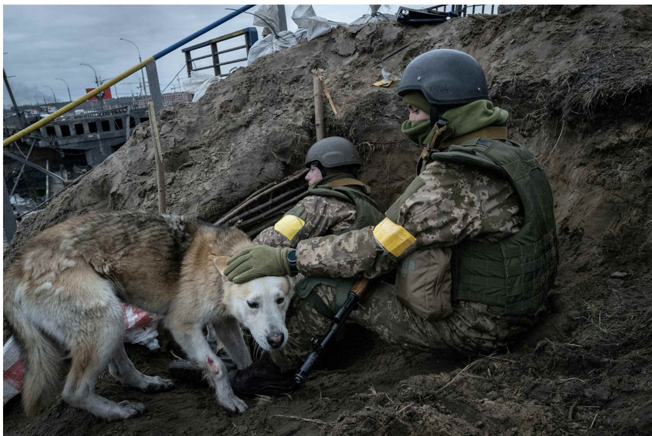
Ukrainsk militär och en skrämmd hund under strider, Irpin, mars 2022.

kommer hit?” Tyvärr är den ryska armén väldigt stark: de har mycket folk, gott om vapen. De kan komma till Charkiv, Kramatorsk, Slovjansk, Zaporizjzja. Varför förstår inte vänstern i väst det? För dem är det samma sak: Avdiivka eller Kramatorsk, det är ”någonstans därborta”. Och för mig är det verkliga städer där det bor verkliga människor. Och jag vill inte att dessa verkliga människor ska bo inom avstånd för artilleri. Det är skillnad mellan när ens stad bombas av Shahed [stridsdrönare eller UAV] och av artilleri – det är helt olika situationer. Vi känner till skillnaden, men för vänstern i väst är krig bara något dåligt. Det är verkligen dåligt, men jag skulle vilja se mer förståelse för den ukrainska verkligheten. Och då räcker det inte bara att komma hit – man måste träffa de människor som bor i städer som kan hamna i frontlinjen. Då blir det tydligt varför Ukraina behöver vapen.