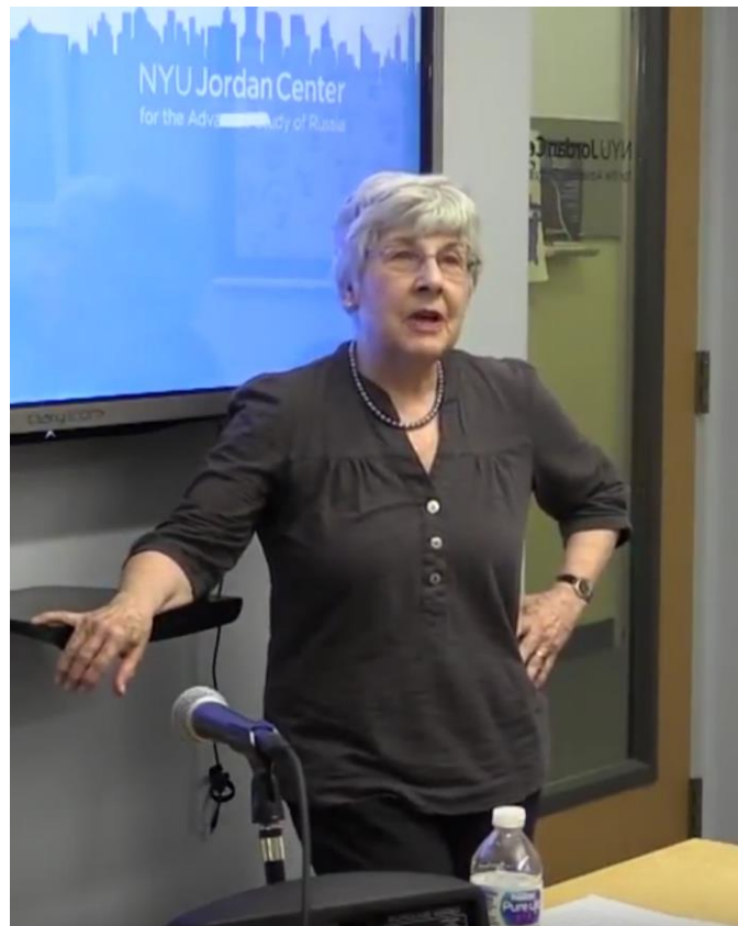
S F vid Jordan Center for the Advanced Study of Russia i New York 1/12 2017

Föreläsningen har översatts från engelska av Göran Källqvist.]