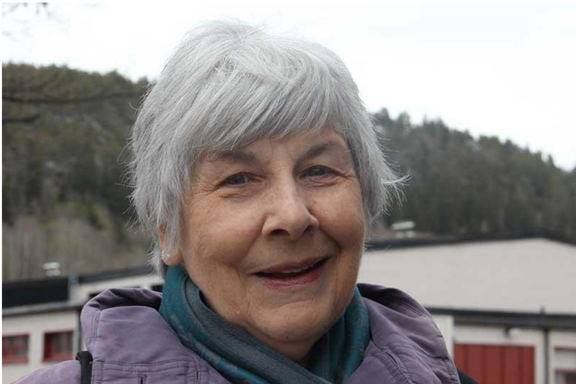
Vladimir Putin är ingen vän av oktoberrevolutionen, förklarar Sheila Fitzpatrick.

- Revolutioner är storskaliga projekt. Putin använde för några år sen ett annat ord: omvälvning. En revolution måste förvisso ha folkligt stöd. Bolsjevikerna hade, efter februari 1917, sitt mesta stöd i städer och i garnisonerna, och i juli var det stora folkmassor på gatorna, som var för uppror. Bolsjevikerna tvekade och avstod. Folkligt stöd kommer och går, som revolten i Kronstadt senare skulle visa. Men bolsjevikerna var absolut ingen sekt.