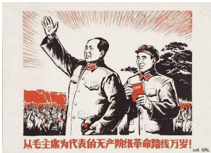
Mao och Lin Biao (affisch från 1967)