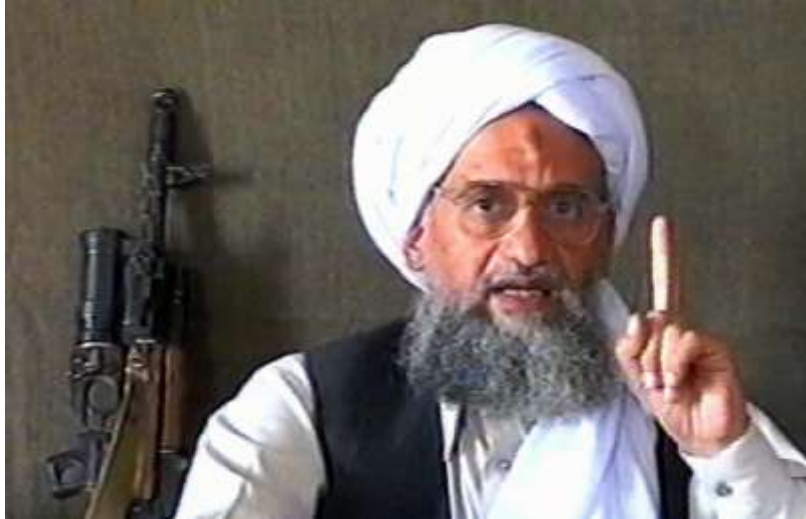
Egyptiern Ayman al-Zawahiri är idag al-Qaidas högste ledare

allierade. De som undanröjs ges ofta närmast militära gradbeteckningar som ”chef för operationerna” för att förstärka betydelsen av att de dödats. Kulmen på, och den mest omtalade, denna till stora delar betydelselösa aspekt av ”kriget mot terrorism” var dödandet av Bin Laden i Abbottabad i Pakistan 2011. Detta gjorde att president Obama inför allmänheten i USA kunde göra ett stort nummer av att vara den som lett jakten på ledaren för al-Qaida. I själva verket hade hans död ingen inverkan på al-Qaida-liknande jihadistgrupper, som gått framåt mest efter 2011.