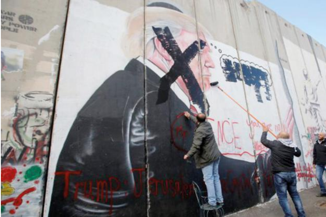
Trumpmålning på Israels mur genom Västbanken.