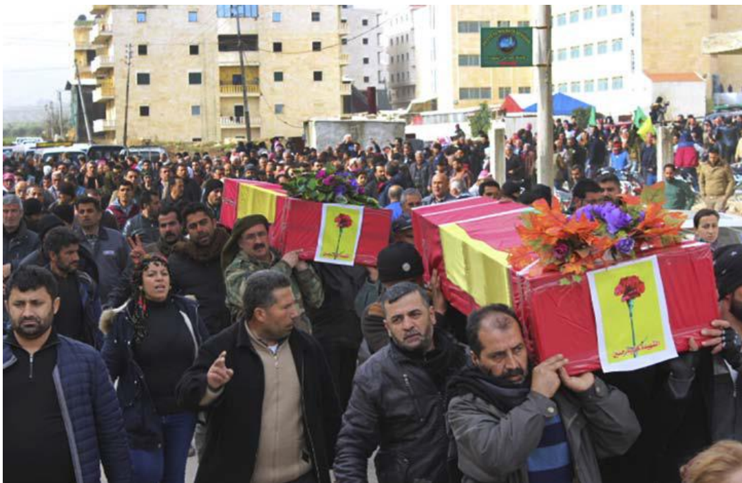
Sörjande i Afrin bär kistorna efter människor som dödats i de turkiska anfällen

Folket i Syrien, araber, kurder och alla andra minoriteter har nu genomlidit sex år av ofattbar förstörelse och våld. Den hämningslösa Assadregimen, IS och olika jihadistmiliser har oupphörligt plågat folket. Saudiarabien, Turkiet, Qatar, Ryssland, Iran och USA har gjort landet till ett slagfält för kamp om inflytande med resultatet total förstörelse. Ovanpå detta kommer nu den turkiska regimens intervention. Folket behöver all solidaritet i kampen mot Erdogans aggression. Och folket i Turkiet behöver nu solidaritet när Erdogan hotar att krossa all opposition mot kriget med järnhand.