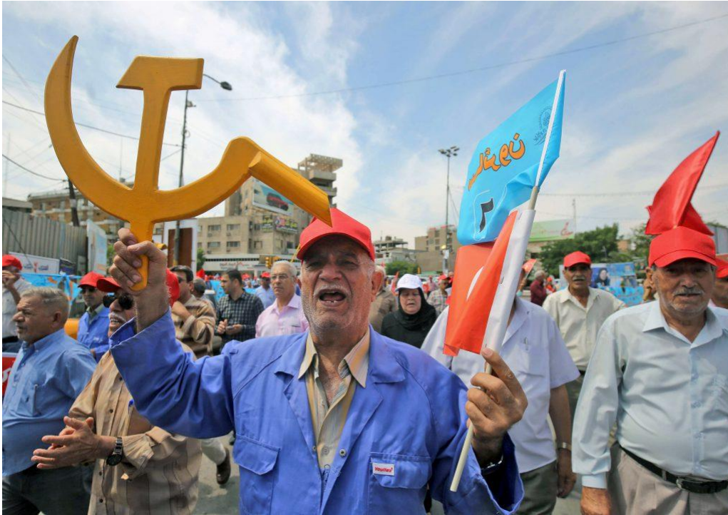
Kommunister demonstrerar i Irak

Många parlamentsledamöter, varav en del hade suttit i parlamentet sedan de första valen efter invasionen 2005, förlorade sina platser. Totalt 215 av 329 deputerade är nybörjare i parlamentet.