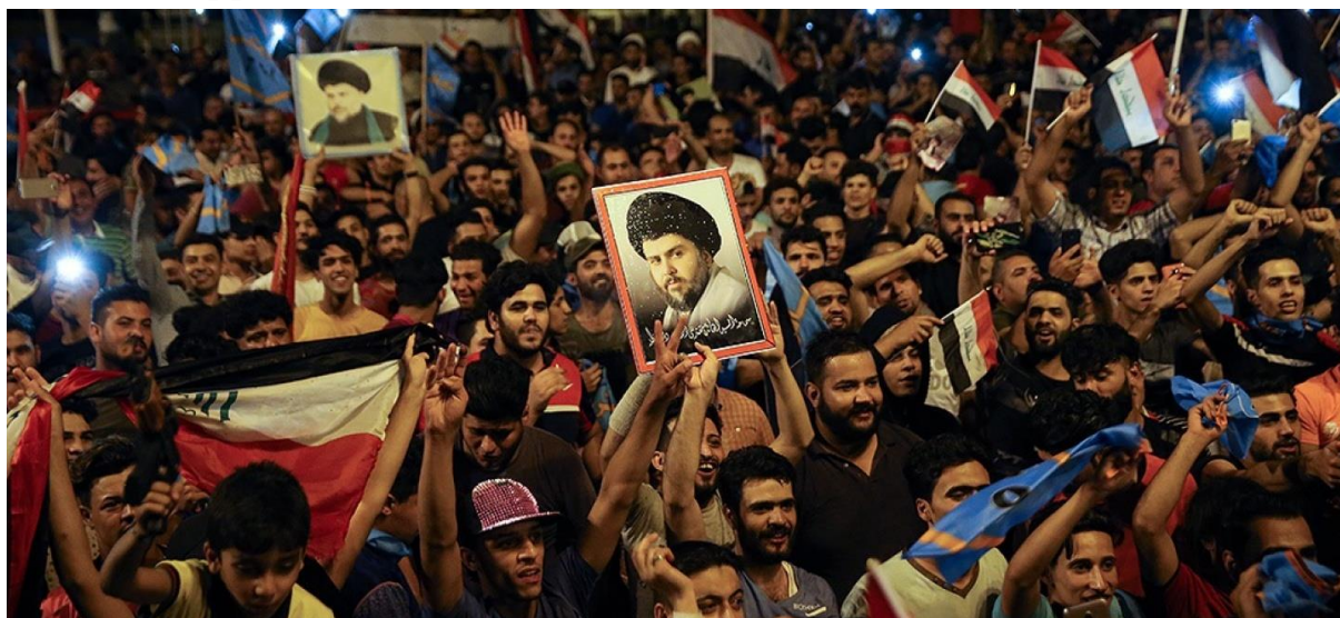
Anhängare till Muqtada al-Sadr i Bagdad firar Sairouns valvinst i valet 12 maj.