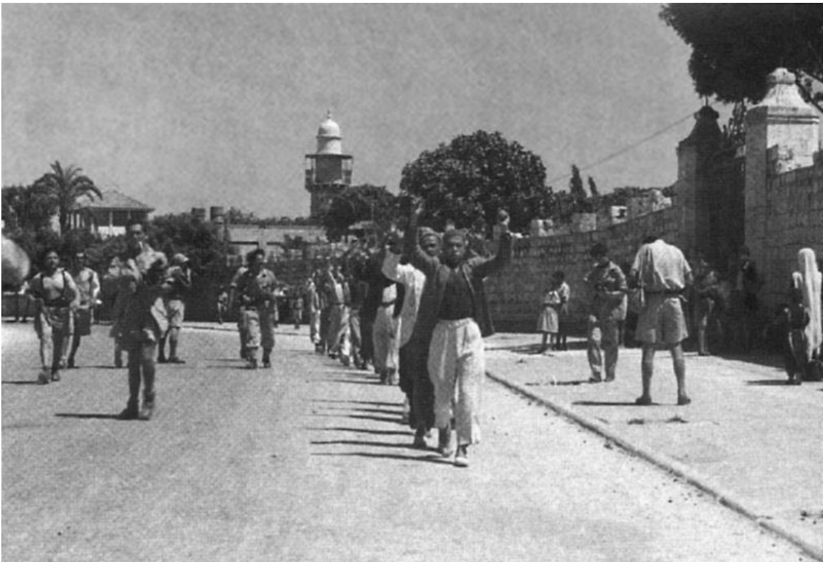
Operation Danni: 1948 förvisades palestinier ut ur staden Ramla i en israelisk militäroffensiv.

Det är bakgrunden till den israeliska etniska rensningen 1948, en operation som slutade med