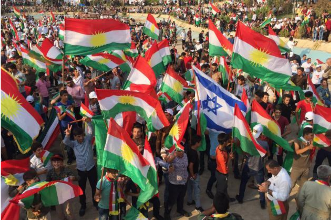
Demonstration för självständighet i staden Arbil den 16 september. Bland de kurdiska flaggorna syntes också israeliska flaggor.

Det finns i nuläget en utländsk ledare som öppet hejar på omröstningen. Det är Israels premiärminister Benjamin Netanyahu. Den 14 september sade han till medier att Israel stödjer omröstningen och etablerandet av en oberoende kurdisk stat.