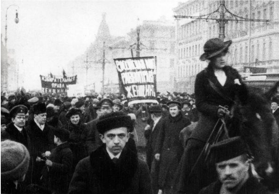
Demonstrationerna i Petrograd störtade tsar Nikolaj för i dagarna hundra år sedan