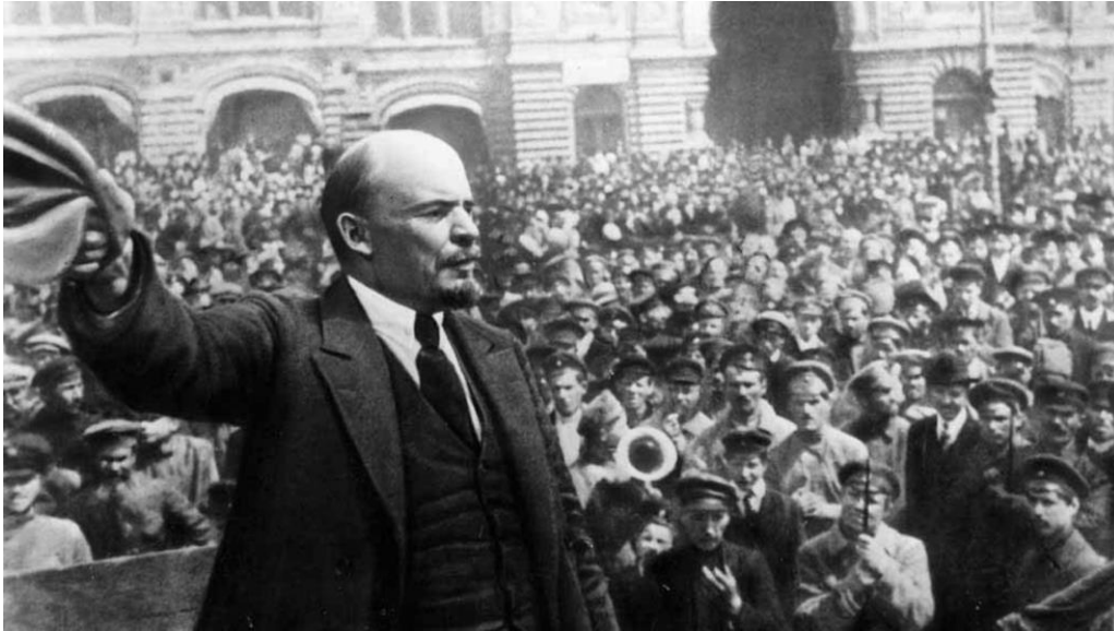
Lenins bolsjeviker klev in på den politiska arenan när februarirevolutionen inte följde folkets vilja

En populär liberal myt om de ryska revolutionerna 1917 säger att februarirevolutionen och den provisoriska regeringen stod för demokrati, men att denna utveckling saboterades av bolsjevikerna i oktober. I själva verket hade den provisoriska regeringen ingen demokratisk förankring, den saknade folkets förtroende och ansvarade för sin egen undergång genom att inte fullfölja februarirevolutionens viktigaste krav.