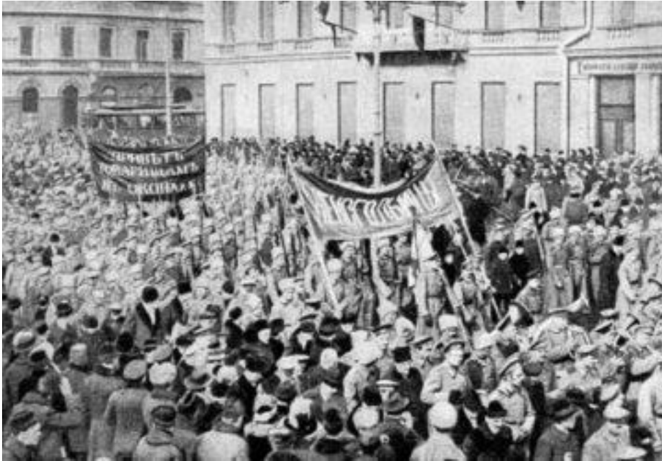
En liten del av folkhavet som dränkte tsar Nikolaj II, Romanovdynastin och hela tsarmakten

Det finns heller ingen anledning att sätta massornas oorganiserade handlande på en piedestal, och önska att revolutionen hade varit mer spontan. Inte minst visar februarirevolutionen på den otillräckligt organiserade revolutionens brister. Att rörelsen saknade en övergripande ledning innebar inte att massornas rena instinkter segrade, utan att andra, ickerevolutionära ledningar tog över – liksom har hänt otaliga gånger senare.