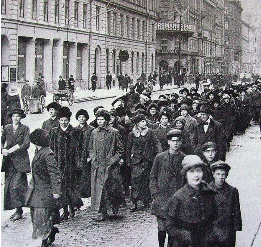
Stockholm: Protesterande mödrar på väg mot Mjölcentralen i april 1917. Hungerdemonstrationer i flera städer banade väg för den allmänna rösträtten som blev verklighet året därpå.