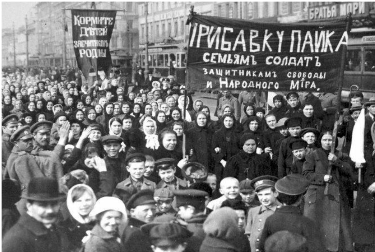
Arbetarkvinnornas strejk blev startskottet för februarirevolutionen.

Men detta är något som representanter för den borgerliga liberalismen – då och nu – har arbetat ihärdigt för att skymma, för att felaktigt försöka ta åt sig äran.