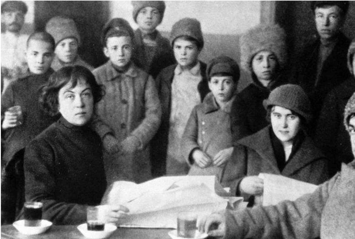
Alexandra Kollontaj, socialist och feminist (sittande till vänster).

Ingen annan händelse i historien har blivit mer förvrängd av det kapitalistiska etablissemanget än den ryska revolutionen. I beskrivningarna av revolutionen nämns knappt kvinnors roll och än mindre de massiva vinsterna för kvinnor som revolutionen gav.