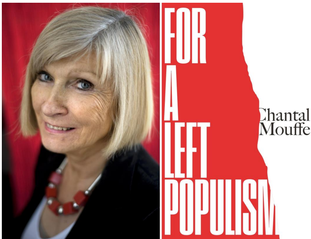
Chantal Mouffe är (efter maken Ernesto Laclaus död) vänsterpopulismens främste teoretiker. For a Left Populism är titeln på hennes senaste bok (2018)

desperation har vänt sig till högerpopulister. Detta är dock en sanning med modifikation. Den genomsnittlige Trump-väljaren var en vit, rik man med låg utbildning. I Sverige har Institutet för framtidsstudier undersökt SD-väljare som tidigare röstat på socialdemokraterna. De visar sig i ekonomiska frågor i allt väsentligt ha traditionella högervärderingar: skatterna är för höga, offentliga sektorn är för stor. Anledningen till att de inte har röstat på Moderaterna är att de har sett dem som ett parti för "eliten". SD, med sin populistiska framtoning, är ett högerparti för folk som inte har gått på universitet.