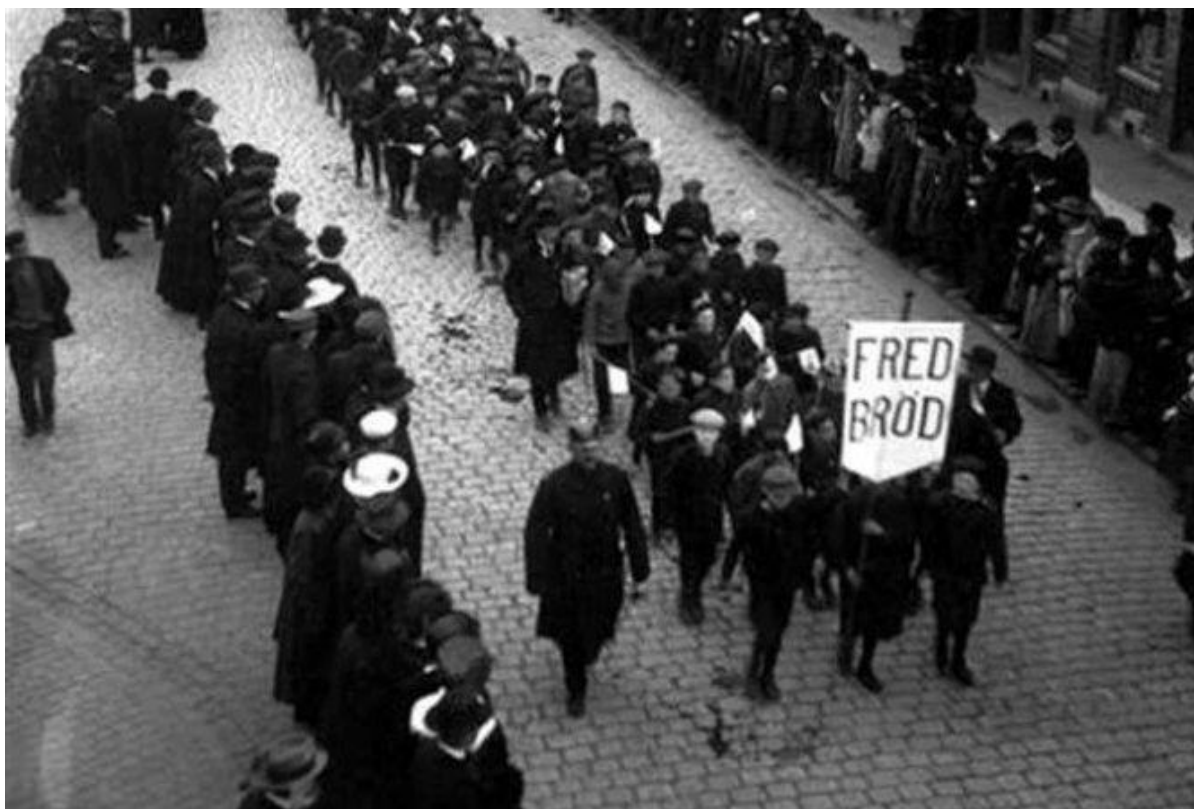
1917: 1 maj i Göteborg, liksom i andra städer, blev rekordstort.

Livsmedelsförsörjningen försämrades drastiskt som ett resultat av kriget, handelsblockader och dålig skörd.