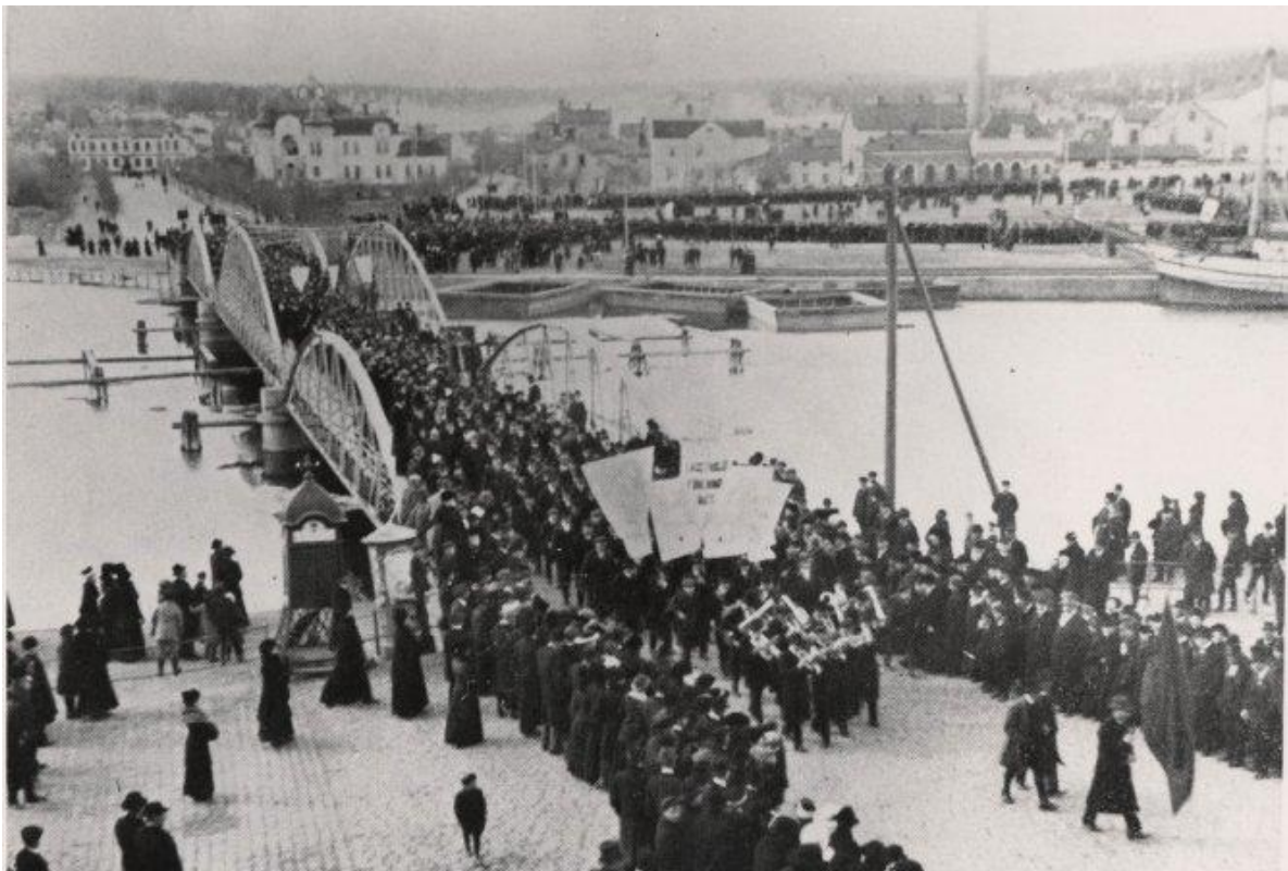
1 maj i Härnösand – en storslagen syn!

Sin allra största omfattning fick de i Ådalens sågverksbygder, där dramatiken inför 1 maj också tillspetsades av agitation för en fritagning av den livstidsdömde Amaltheamannen Anton Nilson, som satt inspärrad i centralfängelset i Härnösand.