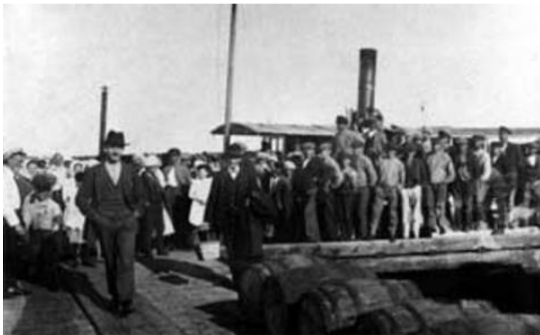
Två av de anhållna arbetarna kommer hem från fängelset.

Söndagen den 3 juni såg det krigiskt ut på Seskarö, tyckte Norrbottens-Tidningens utsände: ”Militär posterade bryggan vilken den civila befolkningen avskurits från genom ytterligare en postering. I skogsbrynet vid Sandviks huvudkontor vimlade det av uniformer mellan tälten. Jagaren Vale låg för ankar ute på fjärden och den med kulspruta bestyckade motorbåten vittnade om extraordinära bevakningsåtgärder”.