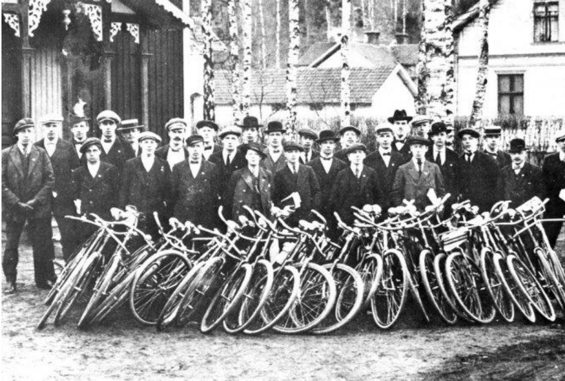
Redo för agitationsturer i Småland.

Men man lyckades inte knäcka arbetarrörelsen, trots att LO-ledningens passivitet lett strejken till nederlag. SAP fortsatte att växa för varje val. Samtidigt klämdes S-ledningen allt mer mellan trycket från borgarklassen å den ena sidan och arbetarklassen å den andra.