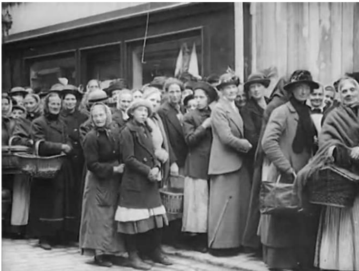
Efter att länge köat förgäves tog tålamodet slut den 5 maj.

uppe i 1 000 deltagare. Polis tillkallades för att utrymma butiken och skingra de som samlades utanför. Kvinnorna litade inte på att butikerna de besökte saknade bröd och potatis.