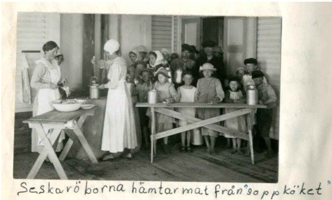
Seskaröborna hämtar soppa från ett av de efter landshövdingens besök upprättade soppköken.

Norrskensflamman och den liberala Norrbottens-Tidningen tog parti för arbetarna och fördömde myndigheternas åtgärder om att sända ”Bly istället för bröd” och ”Kulsprutor istället för mat” till Seskarö. Även den opolitiska Haparanda Nyheter tog arbetarnas parti. Högertidningarna Norrbottens-Kuriren och Haparandabladet försvarade myndigheternas åtgärder. Kuriren kommenterade ironiserande händelserna och sa att detta var slutet för republiken Seskarö.