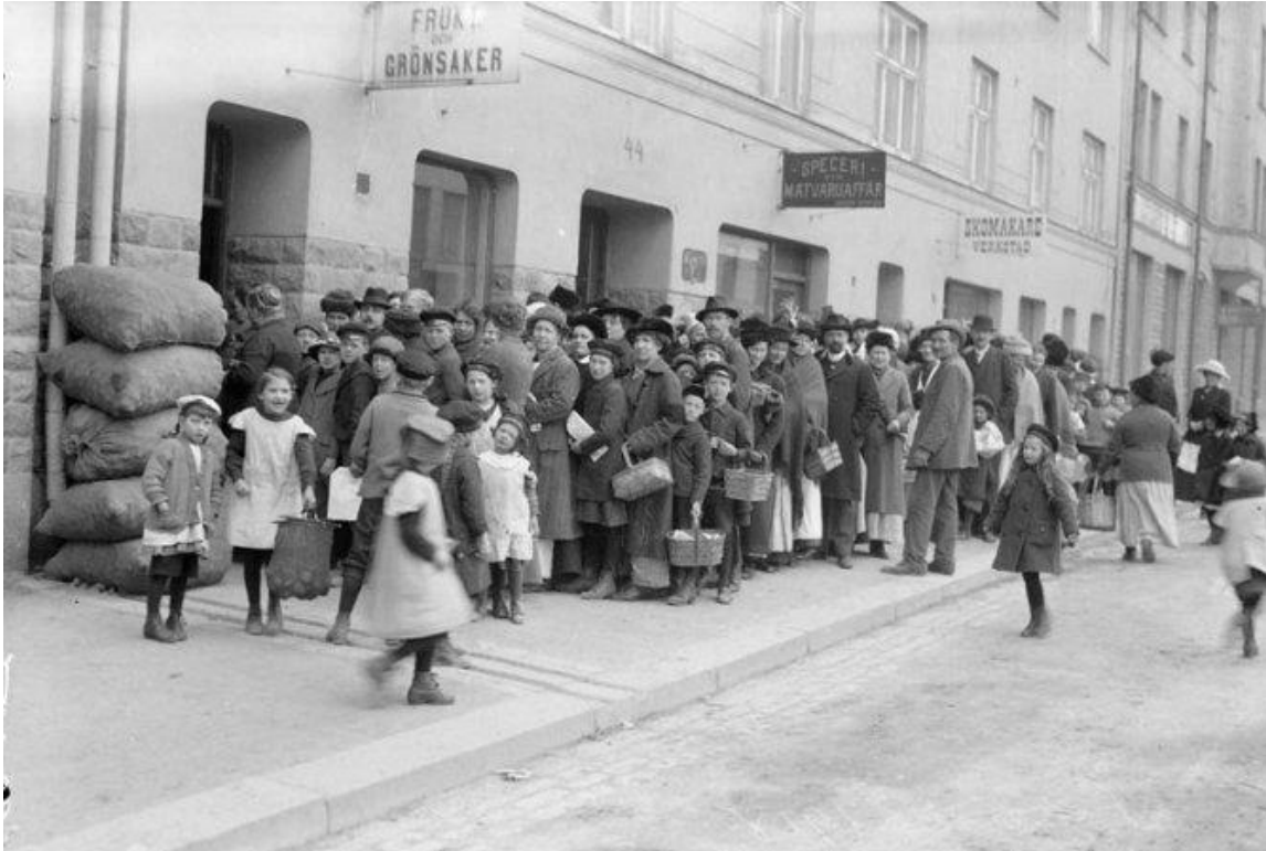
I början av 1917 växte brödköerna, snart skulle tålamodet brista