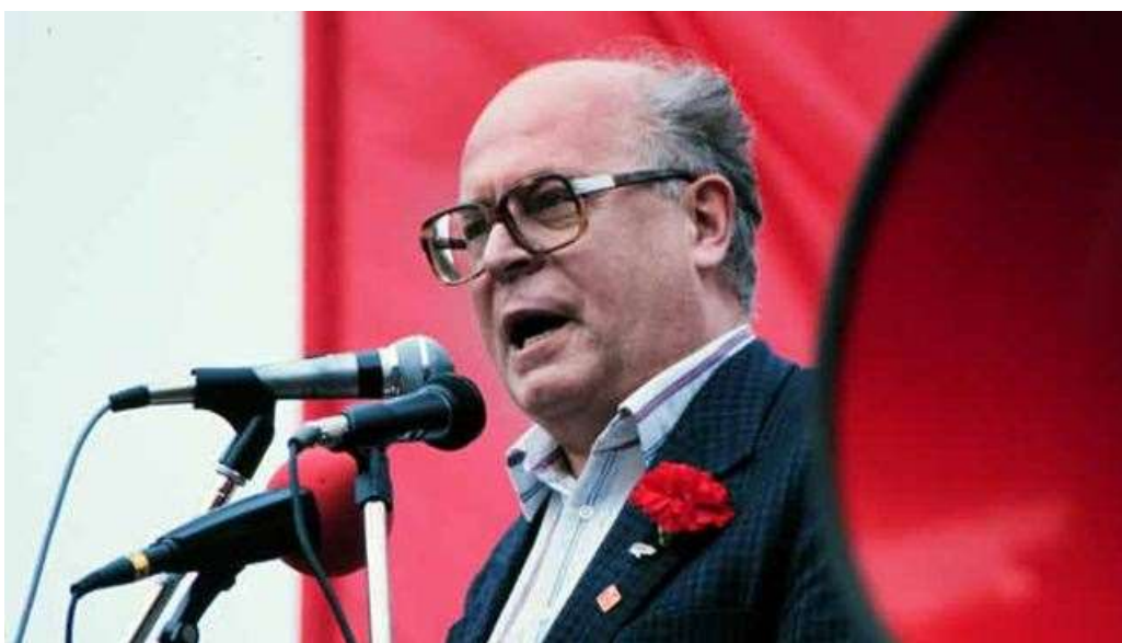
Lars Werner partiledare i VPK 1975–1993

Det går inte att lappa detta politiska vrakgods.