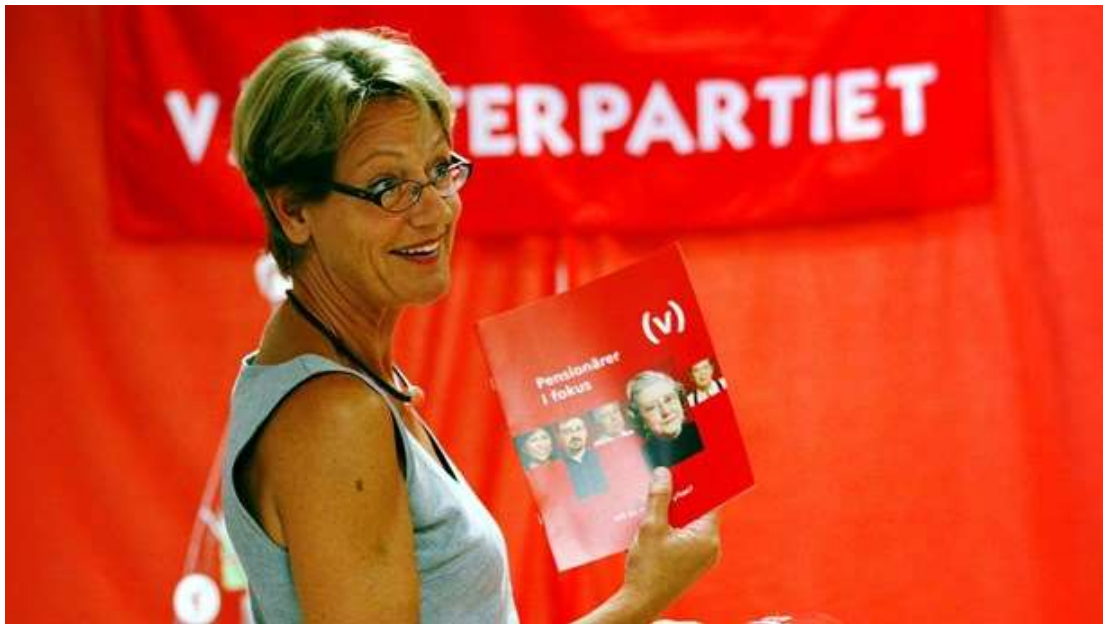
Gudrun Schyman var partiledare för Vänsterpartiet 1993–2003.