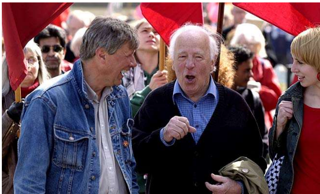
Lars Ohly samspråkar med f d VPK-ledaren CH Hermansson vid Första-maj-tåget 2004

Diskussionen börjar som sig bör i öst. Stalinistdiktaturens fall har fått avgörande betydelse för Vänsterpartiet. En del partimedlemmar har börjat ifrågasätta ”allt”, från nödvändigheten av socialism till att det kanske är möjligt att ”ge kapitalismen ett mänskligt ansikte”.