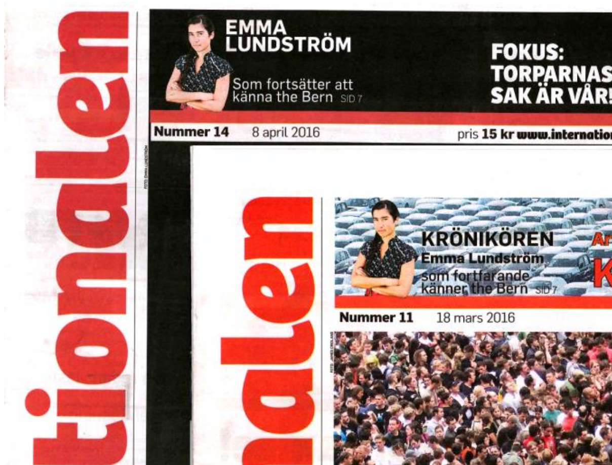
Socialistiska partiets veckotidning Internationaalen känner "the Bern"