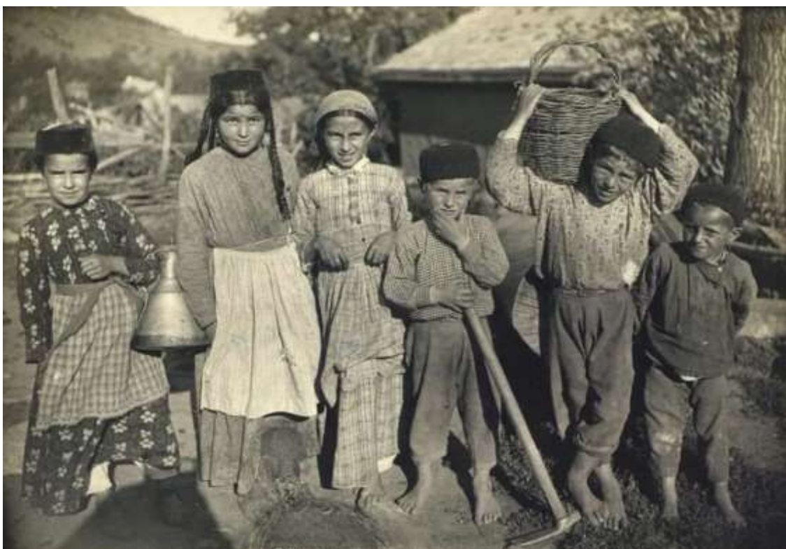
Krimtatarer i Alushta 5 1908.

För det första har det lagts för stor vikt vid det slags historierevisionism som försöker motivera Ukrainas anspråk på Krim istället för en historierevisionism som fyller i blinda fläckar, ifrågasätter missuppfattningar och gör sig en föreställning om Krims historia och nutid i postkoloniala termer. För det andra kom historierevisionismen att användas som ett politiskt legitimeringsinstrument, där man kringgick en mer konventionell och obestriddig form av legitimering, såsom internationell lag. Slutligen är frågan om hur krimtatarernas självbestämmande kan förverkligas i sig kontroversiell och tvetydig både i det krimtatariska och i det ukrainska samhället i stort.