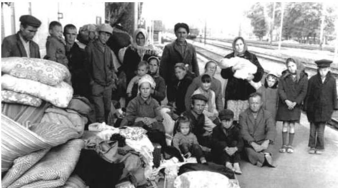
Krimtatarer som försökte återvända men avhystes 1968

Ett annat exempel är den ukrainska online-databasen ”Krim är Ukraina” med arkiv-, musei-, utbildnings- och informationsmaterial. I en artikel med titeln ”Den stora omlokaliseringen av ukrainare till Krim” hävdar författarna att det var tack vare ukrainska ”gästarbetare” som ”arbetade intensivt” under efterkrigstiden (1944-54), som Krim i grunden ”återupplivades” och så småningom överfördes till Ukraina.