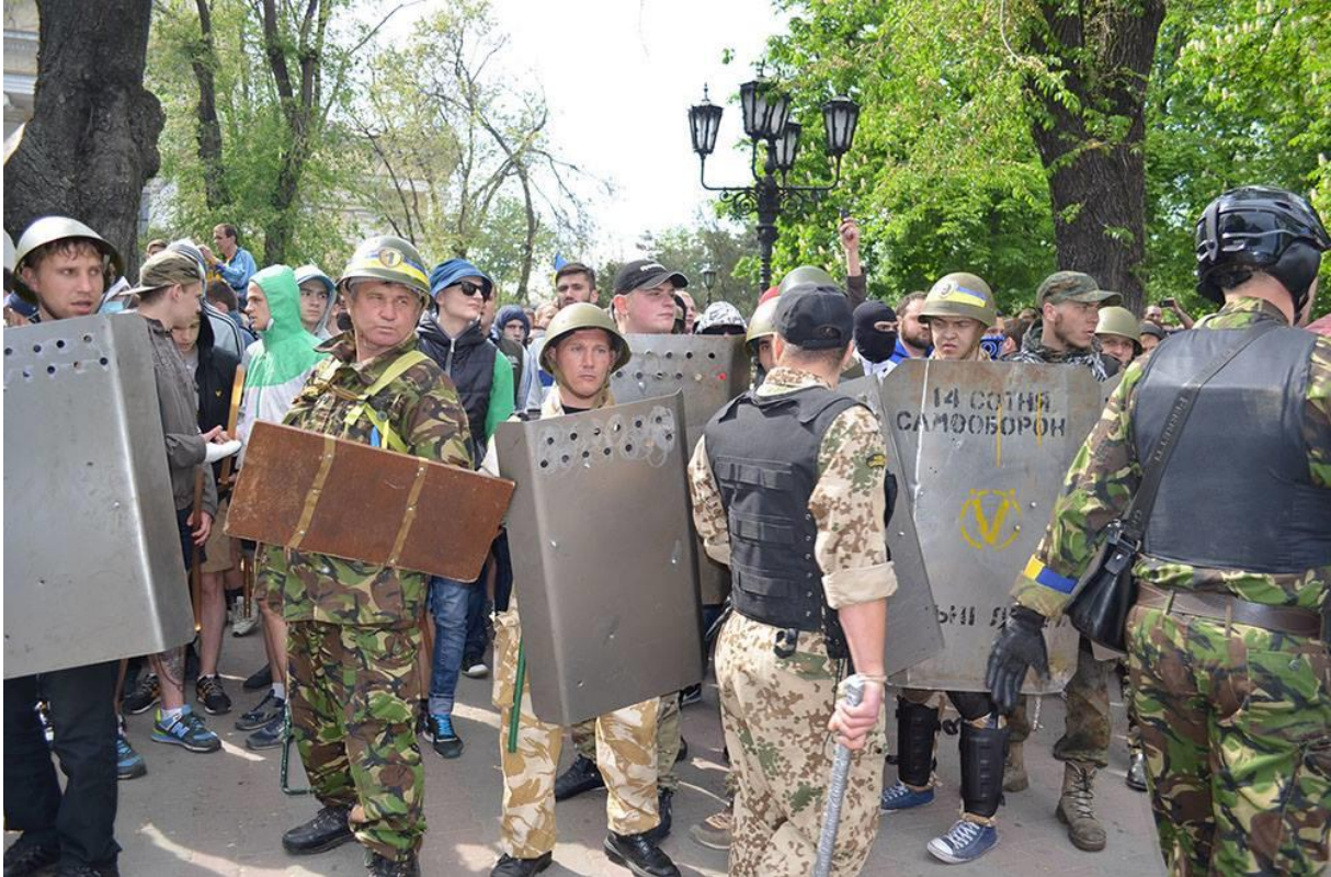
Fascister i Odessa 2 maj 2014

Den andra maj blev en av de blodigaste dagarna i Ukraina sedan den nya högerregimen tog makten i Kiev i februari. Över 40 oppositionella mördades i den sydukrainska staden Odessa när tusentals ukrainska nationalister och nazister tände eld på Fackföreningarnas hus, där den regimkritiska oppositionen sedan flera månader har haft sin bas. Många av de mördade blev ihjälslagna eller skjutna av fascistmobben när de försökte ta sig ut ur den brinnande byggnaden.