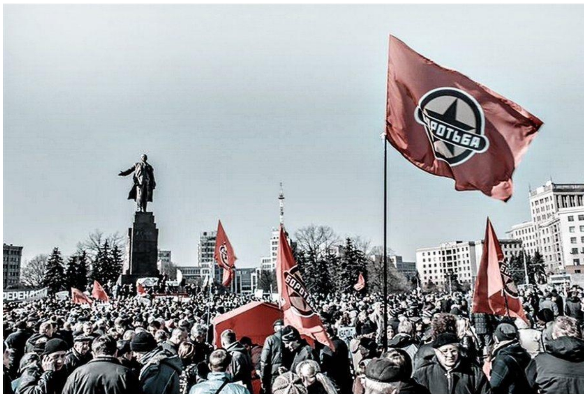
Bilden ovan från demonstration 8 mars 2014 (Internationella kvinnodagen)

Borotba bildades i maj 2011 genom en sammanslagning av flera grupper. Enligt Borotbas egna uppgifter bl a: