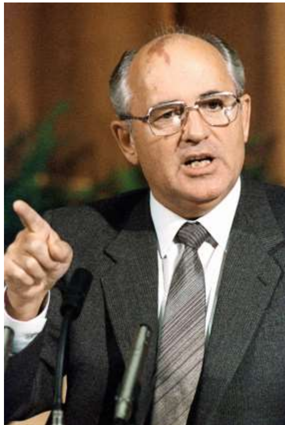
Michail Gorbatsjov (i Reykjavik 1986).

Internationalen 13/4 2022 [ Denna text är en omarbetad och kraftigt utbyggd version av en artikel som tidigare publicerats i Flamman . ]