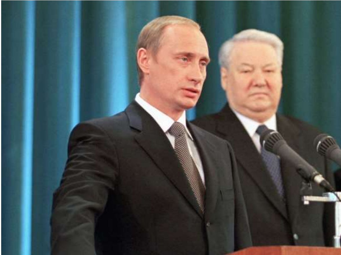
Vladimir Putin med Boris Jeltsin i bakgrunden (maj 2000).

För att häva den sovjetiska stagnationen drev kommunistpartiets reformister, ledda av generalsekreteraren Michail Gorbatsjov, mellan 1985 och 1991 igenom omfattande reformer. Under slagordet Glasnost (ungefär ”öppenhet”) gick landet från auktoritär polisstat (om än en med omfattande sociala rättigheter), till i stort sett fullständig press-, tryck- och yttrandefrihet, på några år. Enpartisystemet avskaffades och 1990 infördes fria val, om än med viss institutionell fördröjning. Den sovjetiska/ryska debatten blev friare och mer dynamisk än någon gång tidigare, möjligen med undantag för revolutionsåret 1917, och nya folkrörelser poppade upp som svampar ur marken. De första demokratirörelserna var spretiga, men såväl de folkliga opinionerna som de livliga rörelser de födde hade tydliga politiska prioriteringar.