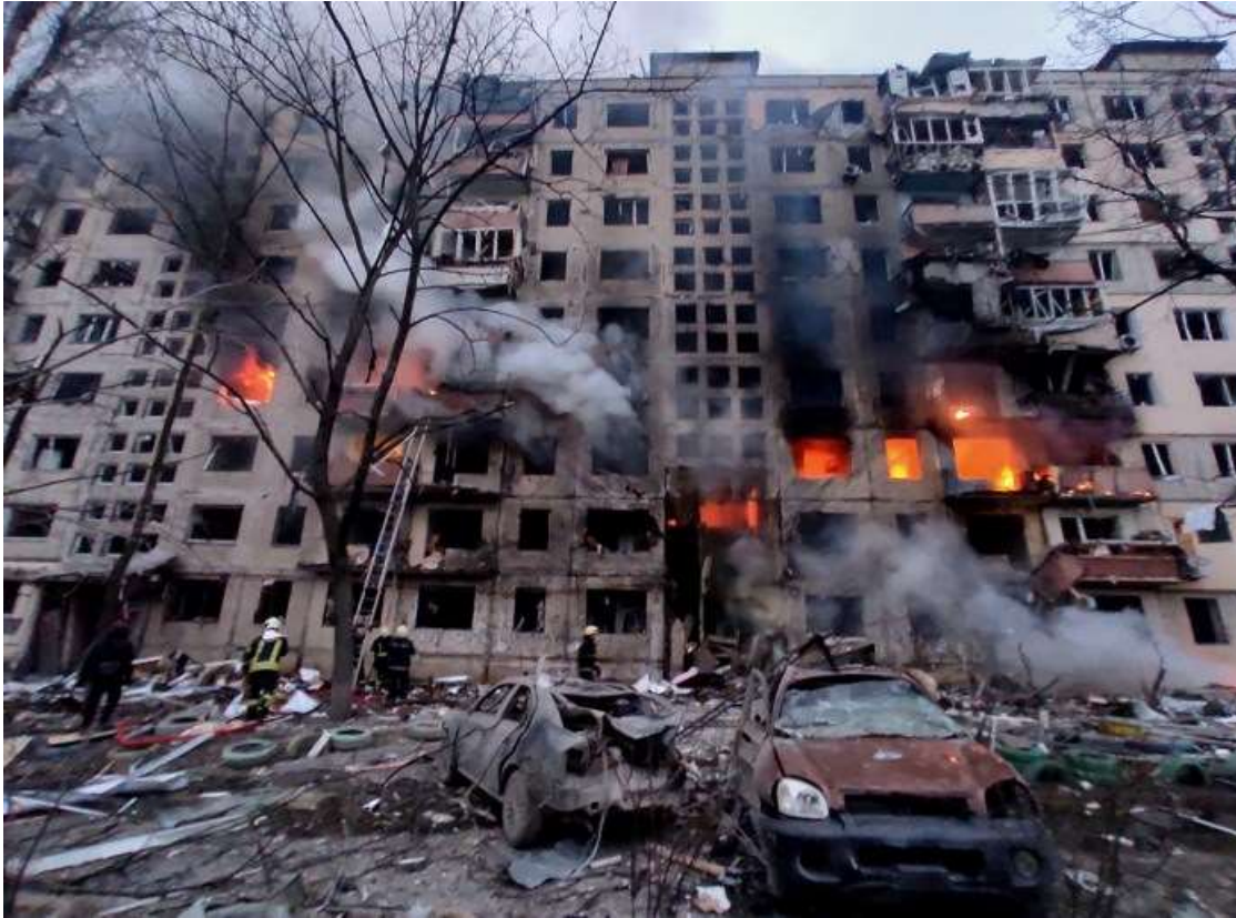
Putinregimen trappar upp terrorbombningarna av civila i Donbass (Foto: CC).

Den dödliga kombinationen av krig, covid-19 och klimatrelaterade katastrofer, som extremtorkan på Afrikas horn, skapar nya hungerkriser och förvärrar de redan pågående. Både Ryssland och Ukraina var före kriget två av "världens brödkorgar" och svarade för totalt 12 procent av det globala kaloriintaget. Tillsammans stod de båda länderna för 30 procent av världens produktion av vete och 20 procent av den odlade majs, två grödor som är basföda för miljarder människor.