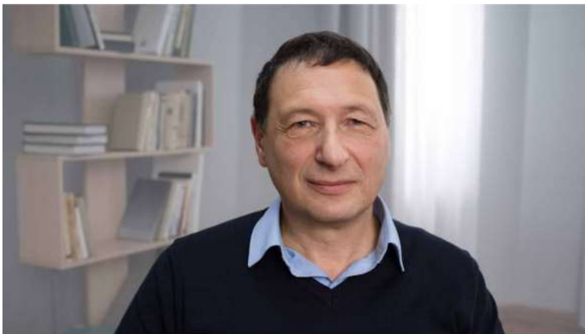
Boris Kagarlitskij är en rysk marxistisk historiker som var dissident under Sovjettiden och även har suttit i Putins fängelse.

– Man ska komma ihåg att den ryska regimen välkomnades i Väst under de första åren av Putins styre, fram tills den globala ekonomiska krisen bröt ut 2008, då relationerna började försämrans till följd av den nyliberala världsordningens kris. Det innebar att gamla motsättningar förvärrades och nya motsättningar uppstod. Det ledde till en konflikt mellan Ryssland och Väst, vilket i grunden också är vad kriget för kontrollen över Ukraina handlar om, sa Boris Kagarlitskij.