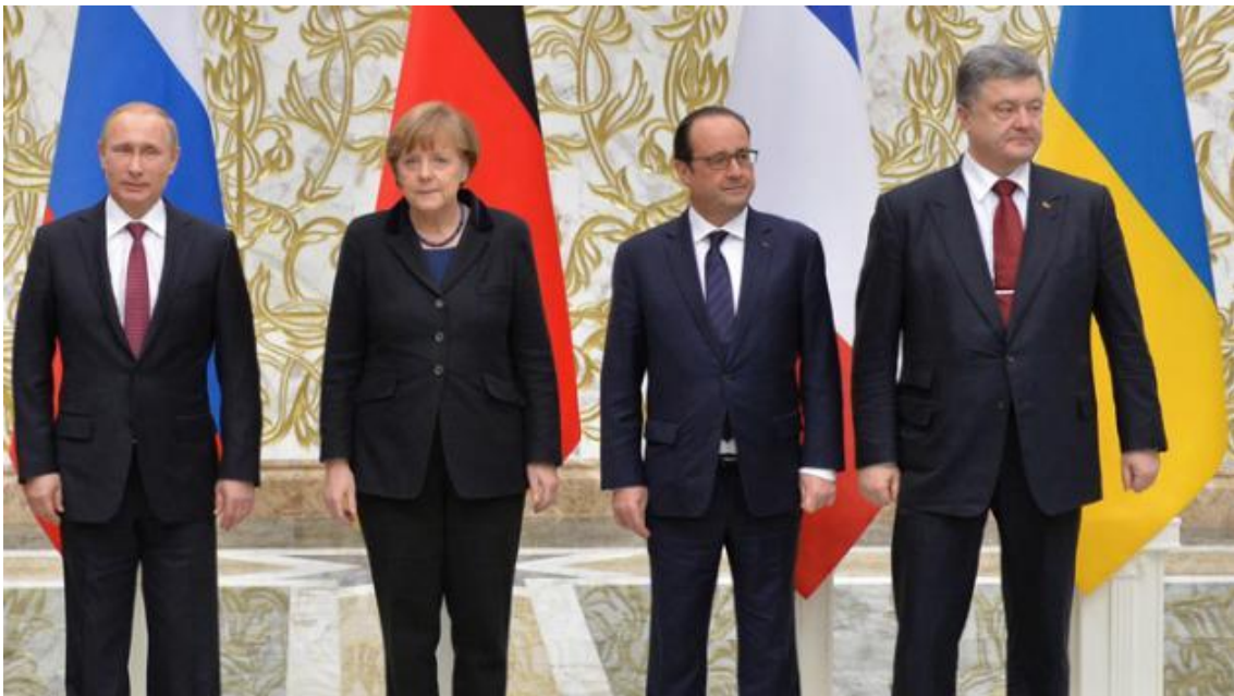
Putin, Merkel, Hollande och Porosjenko i Minsk. Hur länge kommer avtalet att hålla?