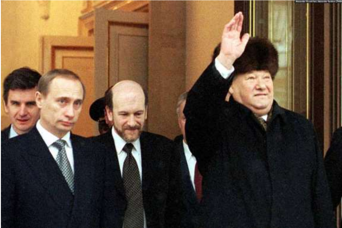
Boris Jeltsin lämnar Kreml. Hans befogenheter överförs tillfälligt till premiärminister Vladimir Putin.

”Björnen anhåller inte om någons tillåtelse. Han betraktas som tajgans suveräna härskare, och jag vet med säkerhet att han avvisar alla planer på att flytta. Aldrig ger han upp tajgan till någon annan.”