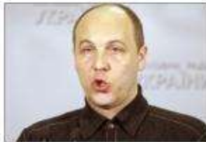
Andrij Parubij, chef för nationella säkerhetsrådet, SVOBODAS GRUNDARE