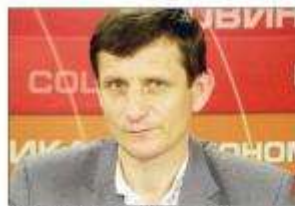
Oleksandr Sych, vice premiärminister, SVOBODA