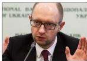
Arsenij Jatsenjuk, premiärminister, FÄDERNESLANDSFÖRBUNDET