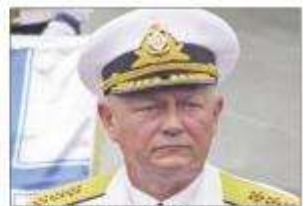
Ihor Tenyukh, försvarsminister, SVOBODA