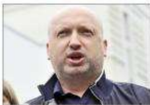
Oleksandr Turtjynov, interimspresident, FÄDERNESLANDSFÖRBUNDET