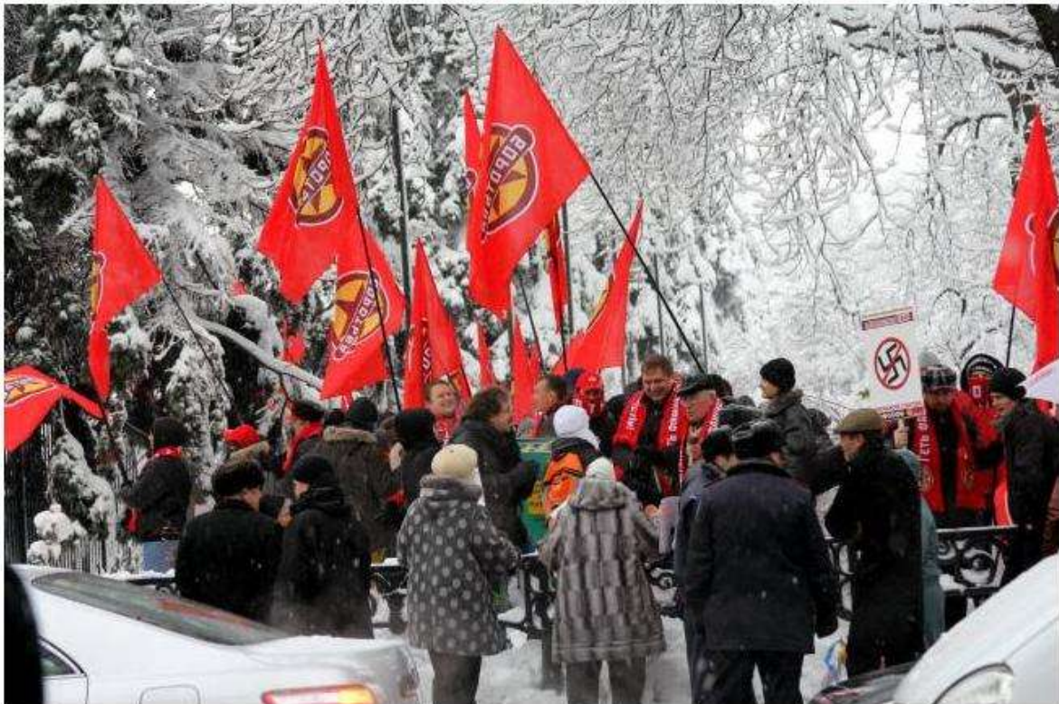
Antifascistisk demonstration med Borotba i Kiev

En folklig revolution störtar Janukovyts korrupta regim av oligarker och kleptomaner. Det väpnade avantgardet i upproret utgörs emellertid inte – trots de breda och brokiga folkmassorna – av demokratiska internationalister utan av extrema nationalisterna och rentav fascister. Västimperiet, USA och EU, stödjer utvecklingen för egna intressen och ser mellan fingrarna på det bruna. Det gör inte ryskspråkiga nationalisterna och andra som fruktar vågen av sönderslagna minnesplatser och partikontor. Istället för appeller till enhet över etniska gränser mot plundrarklassen som ruinerat landet, ljuder slagord om rysk tillhörighet – med militär support från Putins östra imperiebygge.