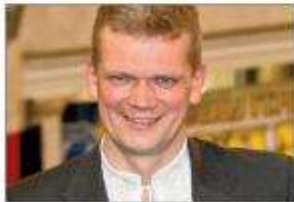
Ihor Shvaika, jordbruksminister, SVOBODA