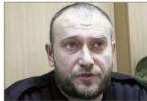
Dmytro Jarosh, biträdande chef för säkerhetsrådet, HÖGERSEKTORN