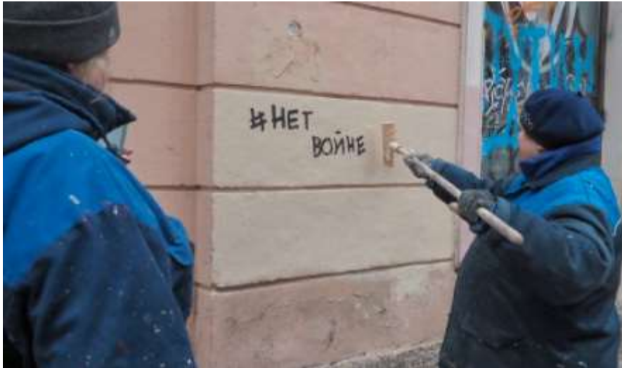
"Nej till kriget"-klotter målas över i St. Petersburg dagen efter protesterna.

– Och de som samlades... ja, man kunde direkt se att det var medelklassen, utbildade ungdomar och unga medelklassmänniskor. Men polisen gick hårt på dem och det var nästan tusen personer som greps.