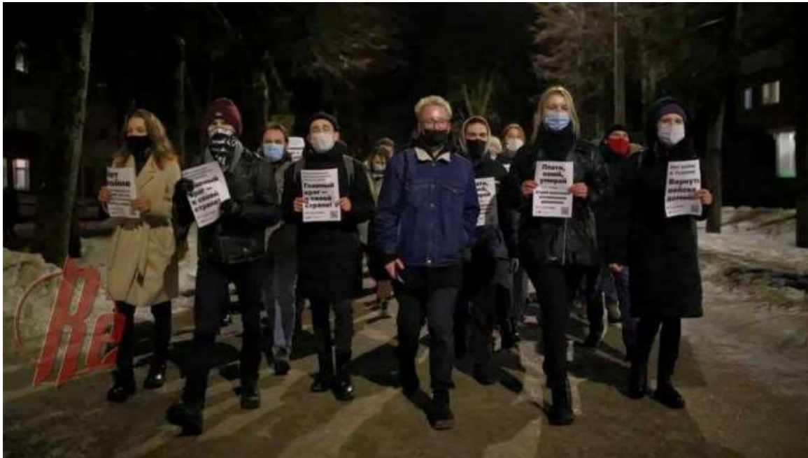
Socialister i Ryssland bygger upp motståndet mot kriget.

Förändringarna sker i en handvändning, som en gigantisk chockdoktrin, alltså en stor händelse som utnyttjas för att driva igenom en drastisk kursändring i kapitalets intresse. Vänstern, arbetarrörelsen och alla som är emot kriget behöver en demokratisk diskussion om dessa frågor.