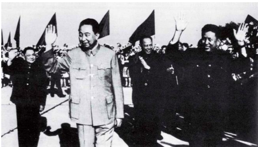
Avskedsceremoni för Pol Pot i Beijing 22 oktober 1977 (till vänster Deng Xiaoping)

Vi vill inte att spänningen mellan Vietnam och Kambodja ska öka. Vi vill att de två sidorna ska nå en lösning genom förhandlingar i en anda av vänskap och förståelse, och genom att göra ömsesidiga eftergifter. När detta är sagt, är vi överens med kamrat Pol Pot om att det inte kommer att bli lätt att lösa problemet med förhandlingar. När det gäller Vietnam är det nödvändigt att vara mycket vaksam. 44