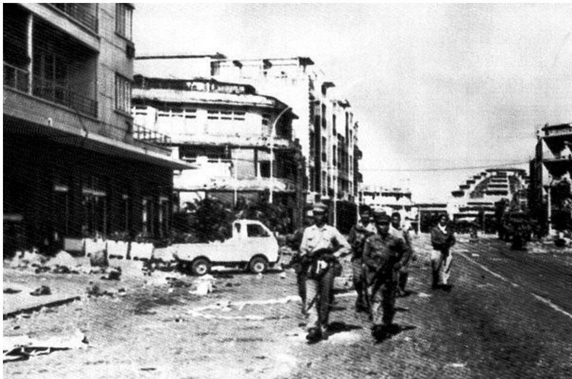
Vietnamesiska trupper i Phnom Penh 7 januari 1979