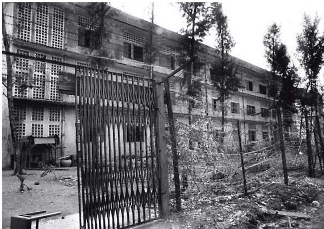
Säkerhetsfängelset S-21, ofta kallat Tuol Sleng, i januari 1979

Chhouks bekännelse utgjorde en vattendelare. För första gången hade en medlem av centralkommittén anklagat andra medlemmar i ledningen för förräderi. 13