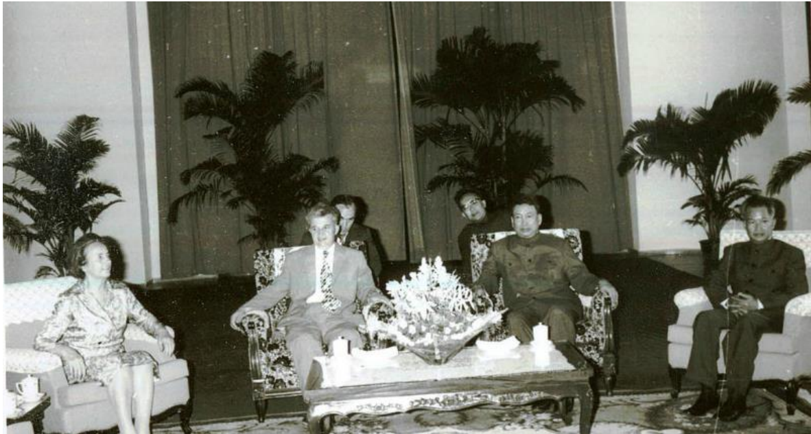
Ceaușescu och Pol Pot

Som ett led i denna process lekte Pol med idén om att inta en högre personlig profil. Det var inte något som tilltalade honom särdeles mycket, men erfarenheterna i både Kina och Nordkorea visade att en personkult var ett mäktigt verktyg för att skapa uppslutning av en nation bakom landets ledare. 49 Vintern 1977 beordrades en grupp artister att måla hans officiella porträtt och skulptera byster av honom i olika material, bland annat i silver. Det verkar som om ingen någonsin visades upp och ett drygt 7,5 m högt revolutionärt monument som visade Pol i en heroisk ställning i ledning för en grupp bönder, vilket var tänkt att resas i Wat Phnom stannade också på designstadiet.