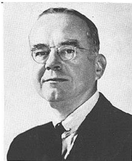
James Burnham (1905-1987)