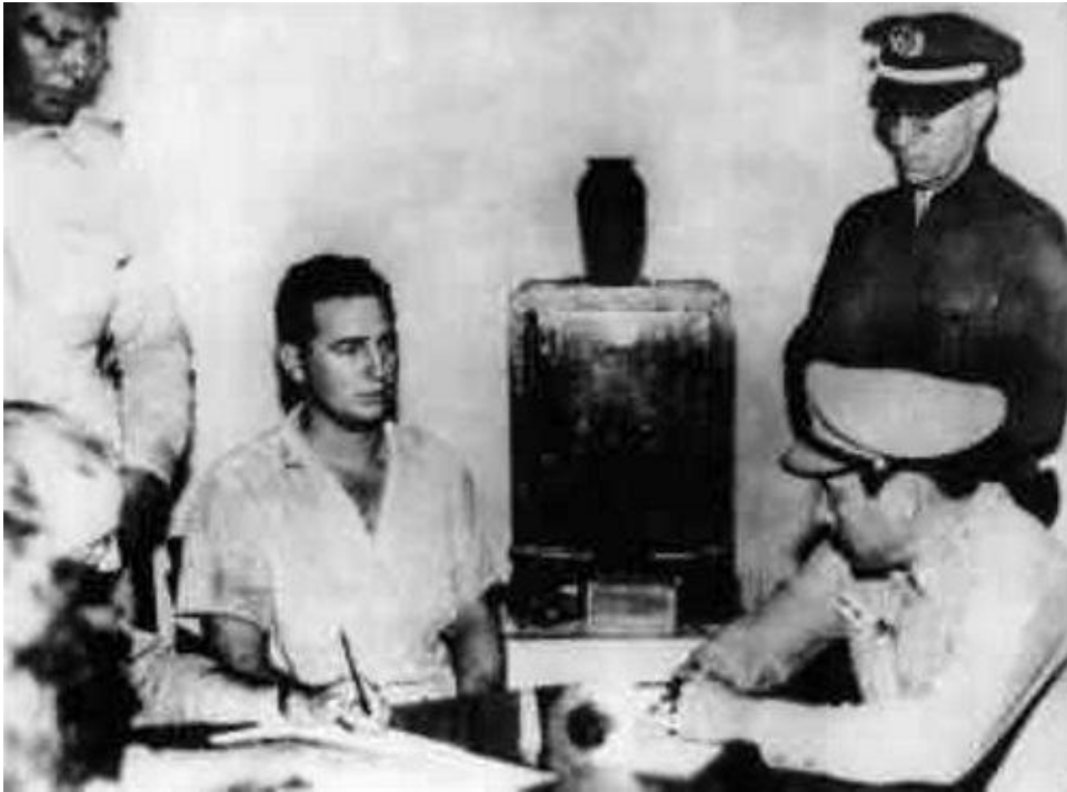
Castro i arrest efter Moncadaattacken

Men attacken, som hade utförts av endast 140 personer, misslyckades och lämnade hälften av dem döda och Castro i fängelse, tills en amnesti två år senare gav honom friheten. Misslyckandet för andra oppositionsrörelser bidrog till att Castros metoder framstod som de enda framgångsrika.