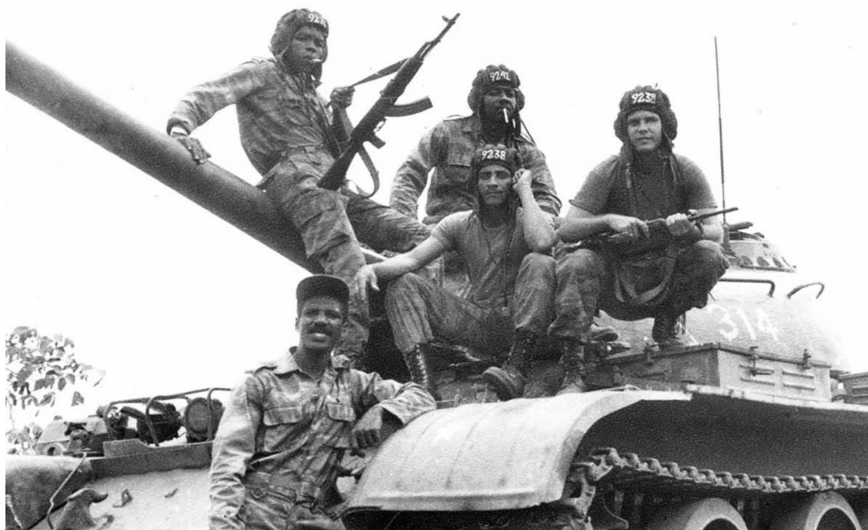
Kubanska trupper i Angola 1989

Han sände senare stöd och soldater till stater i södra Afrika för att kämpa mot apartheid. 11