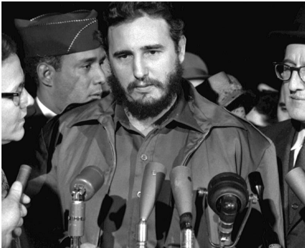
Fidel Castro i Washington 1959.

Ur Socialist Worker (USA) 30/11 2016 (organ för amerikanska International Socialist Organization , ISO). Ursprungligen publicerat i In These Times , 25/11.