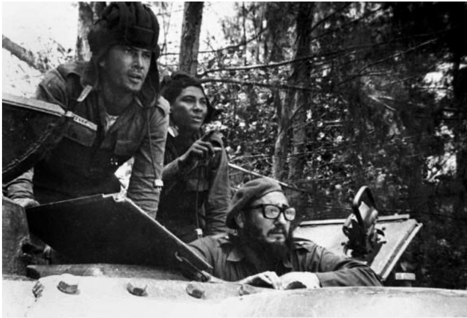
Fidel i en stridvagn under Grisbuktsinvasionen 17 april 1961

Nu är han borta, men han har överlevt alla de amerikanska presidenter som beordrade CIA att organisera hundratals mordförsök, inrikespolitiska väpnade uppror och fullskaliga invasionsstyrkor. Hans död och den kubanska statens nära förestående sammanbrott har förhastat tillkännagivits ett antal gånger sedan 1989. Till skillnad från Ryssland och Östeuropa har Kuba inte förfallit till gangsterkapitalism eller drabbats av de katastrofala effekter på levnadsstandard och livslängd som dessa länder har gjort. En jämförelse mellan hur Haiti och Kuba besvarade orkanen nyligen visar på ett målande sätt att framstegen från revolutionen 1959 fortfarande överlever. På Kuba dog ingen och hela städer evakuerades på ett smidigt sätt. Hans vapenbroder från de första striderna, Raúl, leder fortfarande regeringen och är förpliktad att lämna över ledarskapet 2018. Obamas vändning till mer vänskapliga relationer med Kuba är en framgång för det kubanska folket, det har lättat på en del restriktioner och skulle kunna gynna den ekonomiska tillväxten. Under ett besök till Kuba i september i år såg jag ett myller av kryssningspassagerare i det gamla Havanna. Direktflyg från USA till Kuba började i somras till Santa Clara och utvidgades nu i veckan till Havanna.