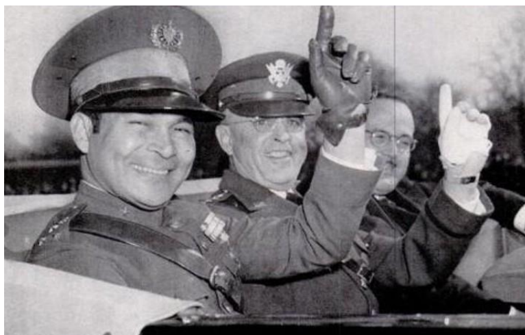
Kubas diktator Fulgencio Bastista med USA:s arméstabschef Malin Craig.

Samtidigt hade ön en stor arbetarklass som hade utvecklat kämpande traditioner, som började med en stark anarkosyndikalistisk tendens, senare ett stridbart kommunistparti, en stor vänsteropposition, en mycket upprorisk generalstrejk 1933, och så vidare. Den nationella och den sociala frigörelsen hade blivit nära sammanflätade med varandra, till exempel för Julio Antonio Mella, som grundade det kubanska kommunistpartiet, och Antonio Guiteras, som grundade Joven Cuba-rörelsen, men även för andra.