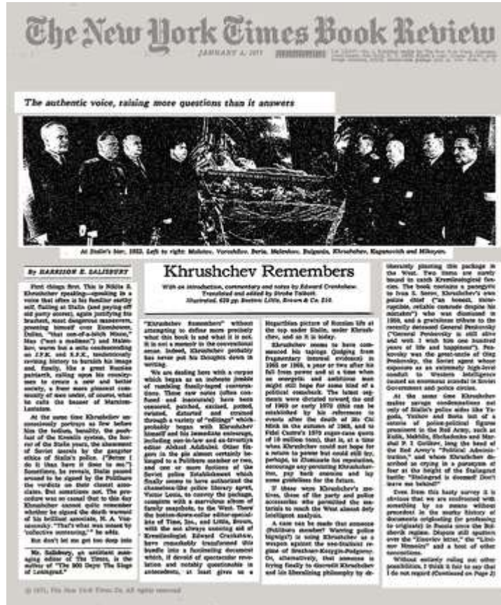
The New York Times Book Review från januari 1971 kommenterar Chrusjtjov minns

De kursiverade inledningarna i resp avsnitt och noterna är författade av den brittiske historikern Edward Crankshaw (dvs inte av Chrusjtjov själv) – tillägg av undertecknad anges inom [].