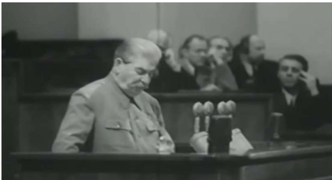
Ovan: Stalin håller tal på 19:e kongressen

Kongressen sammankallades, rapporterna avgavs och diskussionen inleddes. Diskussionsperioderna var korta. Stämningen inom partiet på den tiden bidrog knappast till att uppmuntra debatt av de förslag som framställdes i de rapporter som avgavs av ledarskapet. När kongressen närmade sig sitt slut, diskuterade vi Saburovs rapport om femårsplanen. Det var den sämsta femårsplan som någonsin hade antagits av en partikongress. Den var dåligt utarbetad och illa presenterad. Senare, efter Stalins död, var vi tvungna att åta oss ansvaret för att fullfölja den. Eftersom planen från första början hade varit omöjlig, hade vi inget annat val än att vidta vissa förändringar. Som regel skulle det ha varit otänkbart att göra ändringar i ett dokument som hade godkänts av partikongressen, men det här var ett specialfall, det var uppenbart för oss att den här femårsplanen inte kunde leda oss någonstans. Om jag minns rätt, gick vi till och med så långt i våra försök att finna på ett demokratiskt sätt att ändra femårsplanen så att dess målsättning åtminstone i någon mån var realistisk att vi delade ut de föreslagna ändringarna bland delegaterna. Kort sagt, vi valde den enda rationella metod som stod öppen för oss.