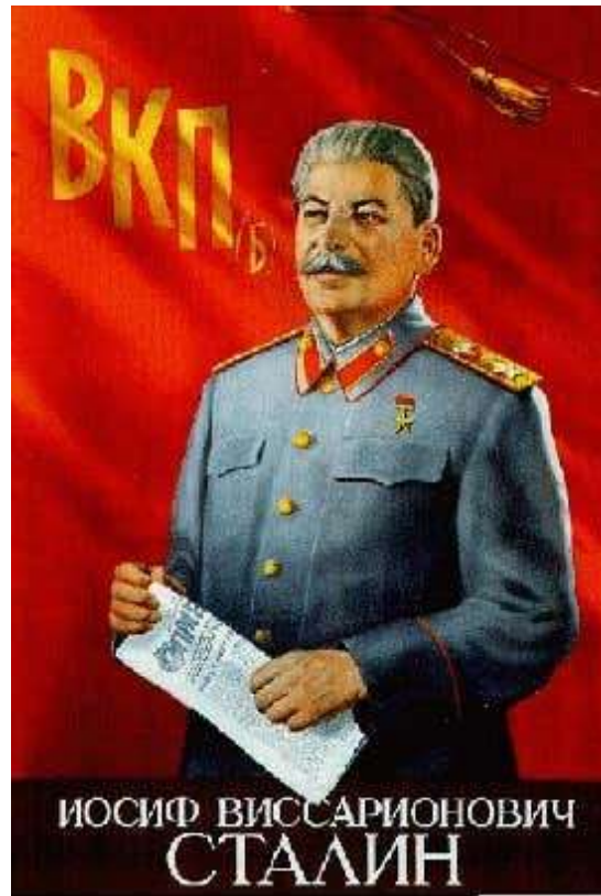
Stalin håller ett exemplar av Pravda i sina händer.

Vid tiden för XIX:e partikongressen (1952), hade Stalin redan satt sig in i rollen som den store tänkaren och författat ett antal teoretiska verk. Allt detta började några år före kongressen när han blev inblandad i en polemik om lingvistik. Det var en mycket egendomlig debatt, och för honom var den absolut inte till något gagn. Han inbjöd en av sina vänner, en georgisk vetenskapsman till middag, och av någon anledning började han diskutera språkfrågor med denne man. Senare skrev Stalin sina artiklar om lingvistik, i vilka han angrep just denne samme georgiske vän. Det var så som Stalins teoretiska verk började komma ut under de sista åren av hans liv.