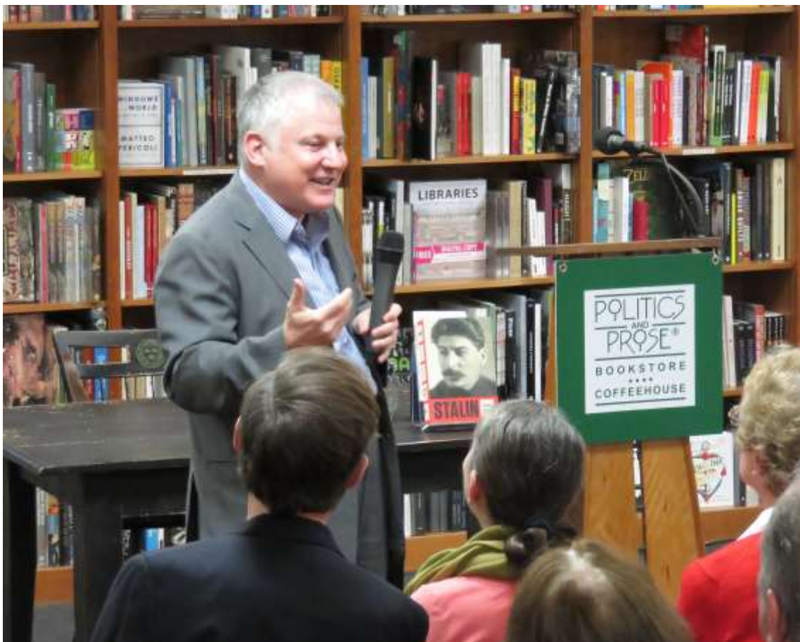
Stephen Kotkin föreläser om sin Stalin-biografi