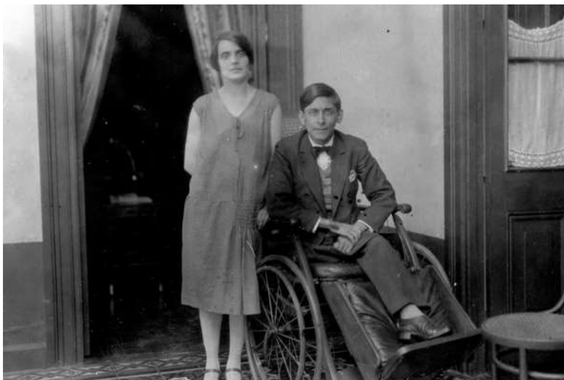
Mariátegui var svårt sjuk ända från barndomen och dog bara 35 år gammal.

Han led hela liv av dålig hälsa efter en sjukdom i barndomen och tillbringade de sista åren i rullstol.