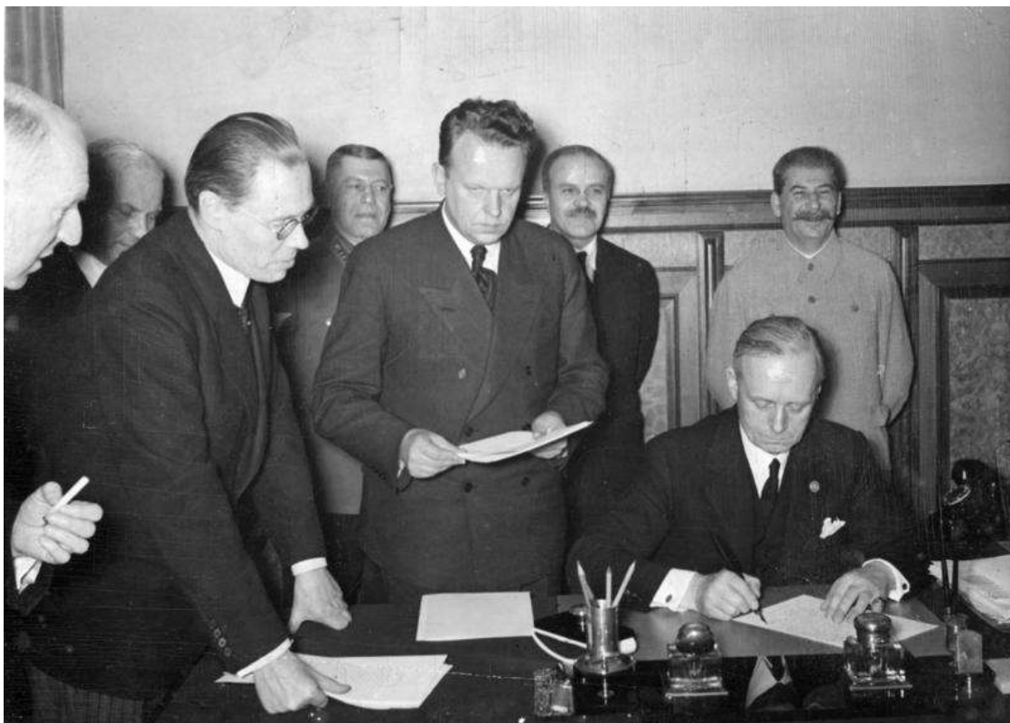
Utrikesminister Ribbentrop skriver under icke-angreppsavtalet mellan Nazityskland och Sovjet. Längst bak står general Sjaposjnikov, Molotov och Stalin. Licens: CC-BY-SA 3.0

Den 23 augusti 1939 undertecknade Stalin och Hitler således en tioårig icke-angreppspakt. En pakt av det slag som diplomatins historia sett oräkneliga gånger och som någon av undertecknarna ofta brutit mot före dess utgång. Därmed skulle det gå att beteckna den som en banal upprepning av en normal diplomatisk manöver. Men den här gången fanns en särskild aspekt bakom: den fullbordades med ett hemligt avtalsutkast om nära samarbete mellan Wehrmacht och Röda armén, något som den sovjetiska regeringen inte skulle erkänna förrän strax före Sovjetunionens upplösning.