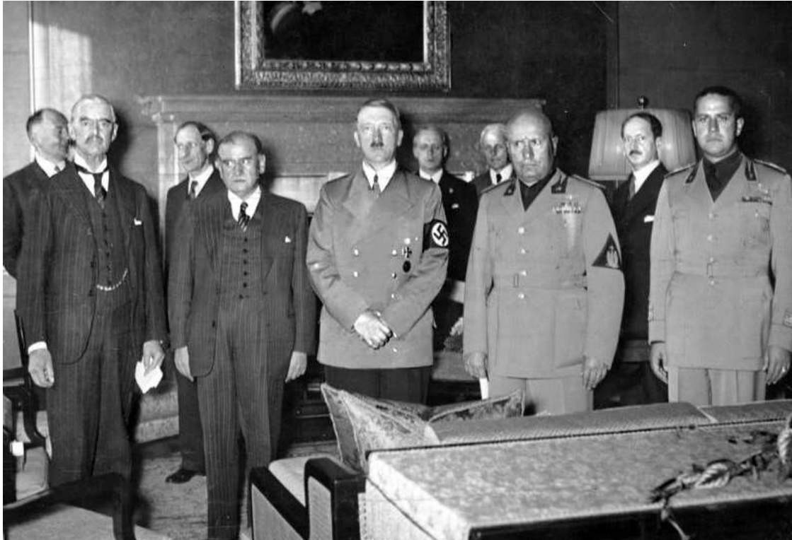
Deltagarna vid Münchenöverenskommelsen: Från vänster Neville Chamberlain, Édouard Daladier, Adolf Hitler, Benito Mussolini och Galeazzo Ciano. Bakom dem bland andra Joachim von Ribbentrop och Ernst von Weizsäcker.

ning. Överenskommelsen förkroppsligade den brittiska bourgeoisieens politik, som främst var inriktad på att försvara det enorma kolonialväldet som skakades av den kamp för självständighet som uppstått bland de koloniala folken efter den ryska revolutionen. För britterna var Sovjetunionen, som man såg som ett uttryck för bolsjevismen, en fiende till kolonialismen och ett större hot mot det egna imperiet än Tredje riket, som ju befann sig långt från koloniernas gränser. Dess strävan var också att få naziregimen att via upplösningen av Tjeckoslovakien inrikta sig på en expansion österut. Hitlers hysteriska och rituella invektiv mot "judebolsjevismen" tycktes utgöra en garant för att den inriktningen skulle bli framgångsrik.