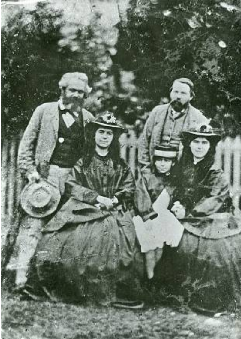
Karl Marx med sina döttrar och Friedrich Engels på 1860-talet.

beskrev som en generalstrejk. Han inspirerades av förkämparna för slaveriets avskaffande och de slaverifientliga frihetskämpar som tog upp vapen i den amerikanska armén, inklusive många av hans tidigare kamrater från den tyska revolutionen 1848 och även många av de tidigare förslavade. Han inspirerades också av de engelska arbetare som stödde nordstaterna och kampen mot slaveriet även när det hotade deras egna intressen, en verklig uppvisning i internationell arbetarsolidaritet. Kort sagt hjälpte det amerikanska inbördeskriget till att omvandla Marx teori om arbete till praktik.