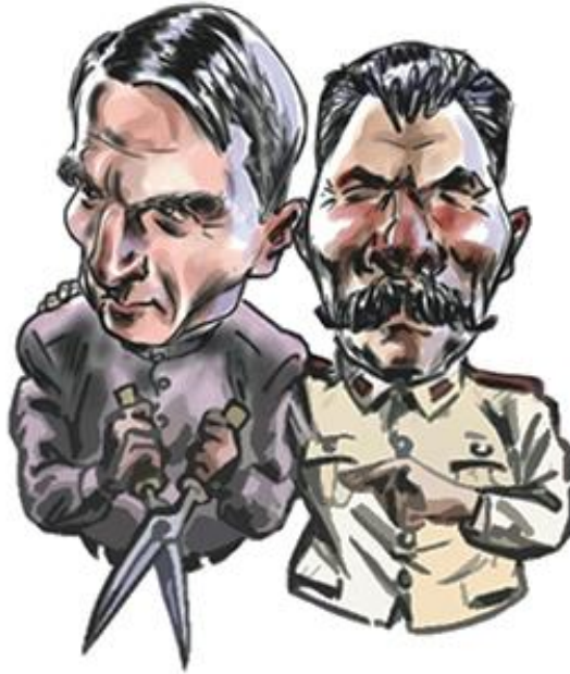
Lysenko och Stalin

Under nära 30 år dominerade Lysenkos ovetenskapliga teorier om evolution biologin i Sovjet. Se även lästipsen allra sist.