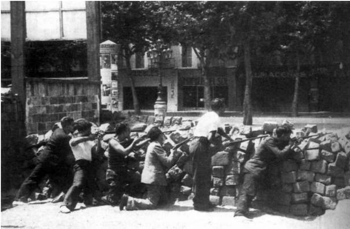
Bemannad barrikad i Barcelona i maj 1937