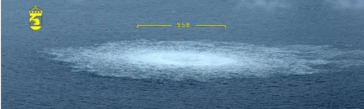
Gasläckan i Östersjön, fotograferad från Kustbevakningens flygplan den 27 september.