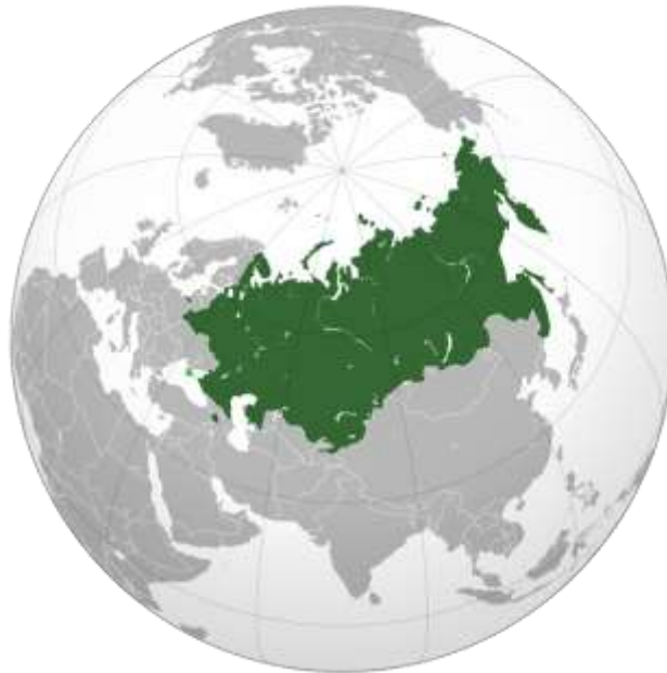
Eurasiska ekonomiska unionen (EaEU)

2014 var ryska direktinvesteringar i Eurasiska ekonomiska unionen (EaEU) [en av Ryssland dominerad version av Europeiska Unionen, EU] nära 15,4 miljarder dollar, dvs 4,0 procent av de sammanlagda ryska utlandsinvesteringarna. Båda siffror fördubblades på två år (2012-2014) sedan tullunionen mellan Ryssland, Belarus och Kazakstan bildats. De ryska investeringarna varierar från land till land. I Belarus står Ryssland för 57 procent av de utländska investeringarna, medan Cypern och liknande territorier svarar för mindre än 15 procent. Även i Armenien är ryska investeringar betydande: 35 procent av det totala. I Kazakstan är situationen den motsatta: Utländska investeringar med ryskt ursprung uppgår bara till 2,5 procent av det sammanlagda. Nederländernas andel uppgår till 40 procent. Många ryska företag är registrerade i Nederländerna, eller ser till att ha dotterbolag där för att kunna bedriva affärer utomlands. Därigenom kan en undersökning av det egentliga ursprunget till Nederländernas investeringar i Kazakstan innebära en ökning mångfalt av den ryska andelen. Ryska investeringars i Kirgizistan är mindre både i absoluta och relativa termer. 25