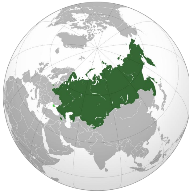
Eurasiska ekonomiska unionen (EaEU)

2014 var ryska direktinvesteringar i Eurasiska ekonomiska unionen (EaEU) [en av Ryssland dominerad version av Europeiska Unionen, EU] nära 15,4 miljarder dollar, dvs 4,0 procent av de sammanlagda ryska utlandsinvesteringarna. Båda siffror fördubblades på två år (2012-2014) sedan tullunionen mellan Ryssland, Belarus och Kazakstan bildats. De ryska investeringarna varierar från land till land. I Belarus står Ryssland för 57 procent av de utländska investeringarna, medan Cypern och liknande territorier svarar för mindre än 15 procent. Även i Armenien är ryska investeringar betydande: 35 procent av det totala. I Kazakstan är situationen den motsatta: Utländska investeringar med ryskt ursprung uppgår bara till 2,5 procent av det sammanlagda. Nederländernas andel uppgår till 40 procent. Många ryska företag är registrerade i Nederländerna, eller ser till att ha dotterbolag där för att kunna bedriva affärer utomlands. Därigenom kan en undersökning av det egentliga ursprunget till Nederländernas investeringar i Kazakstan innebära en ökning mångfalt av den ryska andelen. Ryska investeringars i Kirgizistan är mindre både i absoluta och relativa termer. 25