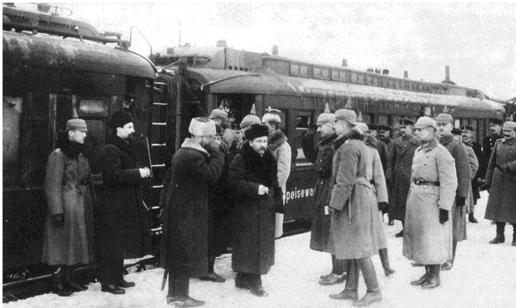
Den ryska delegationen (på bilden Kamenev) anländer till Brest-Litovsk 19 november (2 december) 1917

Lenins deklARATION om fred, ett av de allra första dekret som den andra allryska sovjetkongressen antog den 26 oktober, uppmanade de krigförande länderna att genast inleda fredsförhandlingar. När ententen inte hade kommit med något positivt svar på sovjetregeringens första fredsinstitutiv inledde Sovnarkom separata samtal om vapenvila och fred med centralmakterna. Förhandlingarna startade den 20 november 1917 i staden Brest-Litovsk, där tyskarnas högkvarter i det ockuperade Polen låg, och två dagar senare (22 november) enades parterna om en tio dagars vapenvila, som därefter förlängdes med 28 dagar med förbehållet att den skulle förlängas automatiskt så länge inte den ena parten sade upp den sju dagar i förväg. Under vapenvilan skulle förhandlingar om varaktig fred inledas.