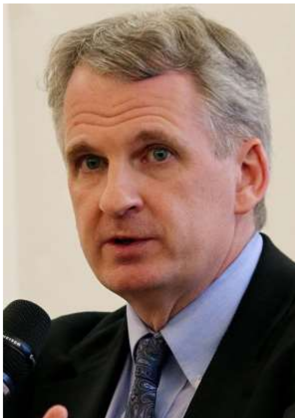
Timothy Snyder

Timothy Snyder, författare till ett tiotal arbeten om Central- och Östeuropas historia, ser den ryska invasionen av Ukraina som en del av Europas koloniala bakgrund. Han ser också detta krig som ett folkmord, som detta definieras i konventionen från 1948.