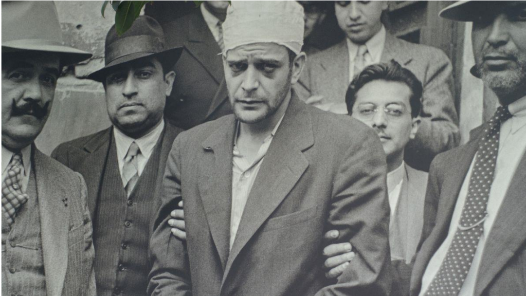
Trotskij's mördare, GPU-agenten Ramon Mercader, framställs på ett mycket positivt sätt i serien.

mest fördelaktiga sätt, som en ärlig journalist med kommunistiska sympatier som inleder ett nära förhållande till Trotskij under förevändningen att han ska skriva hans biografi.