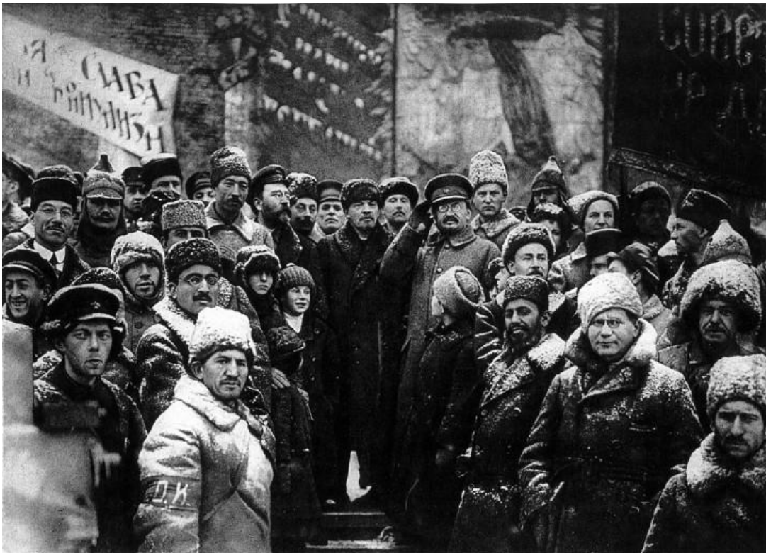
Lenin och Trotskij i Moskva vid firandet av oktoberrevolutionens tvåårsdag.

Huvuddelen av oktoberrevolutionen var arbetarnas och soldaternas massrörelse under bolsjevikpartiet ledning. Men det är inte någonting som vi får se här. Hela revolutionen förminsas till en sorts cirkus eller ett melodrama med skurkar målade i de svartaste färgerna. I stället för historiska förklaringar har vi konspirationens svarta konst. I stället för riktiga personer har vi marionetter, vars ryckiga rörelser dikteras av strängarna som dras av skrupelfria dockspelare. I stället för revolutionära hjältar har vi löjliga och ondskefulla karikatyrer. Men cirkusar och karikatyrer är till för att underhålla småbarn och har ingenting att göra med historisk sanning.