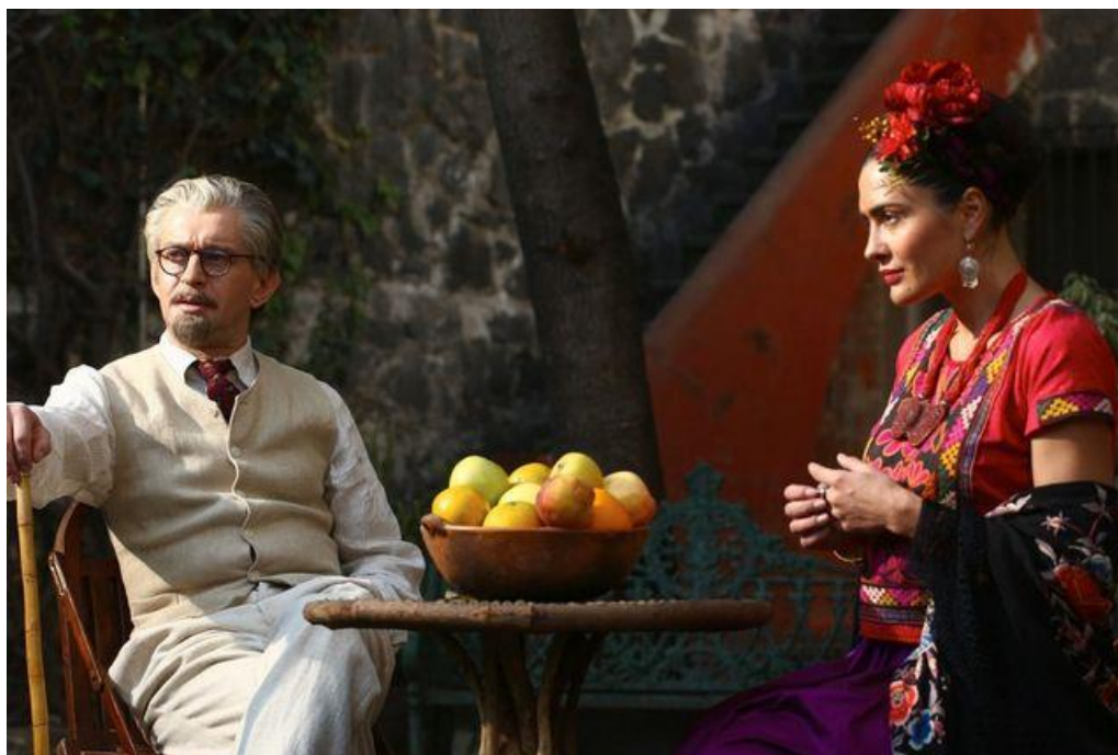
Filmens Trotskij och Frida Kahlo

I hela serien framställs han som en tvångsmässig kvinnojägare. Första delen startar med en våldsam pornografisk skildring där han sexuellt dominerar Larissa Reissner, som framställs mindre som den politiska kommissarie hon var och betydligt mer som företrädare för jazz-epokens nöjeslystnad. I exilen i Mexiko har relationen mellan Trotskij och konstnären Frida Kahlo gjorts till något märkligt masochistiskt, där både hon och Trotskijs hustru, Natalja Sedova, är redskap för hans sexuella impulser och barnsliga fåfänga.