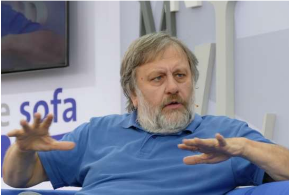
Žižek 2015.

Artikelförfattaren är doktorand i sociologi vid Universitetet i Oslo och medlem i Socialistisk Politik