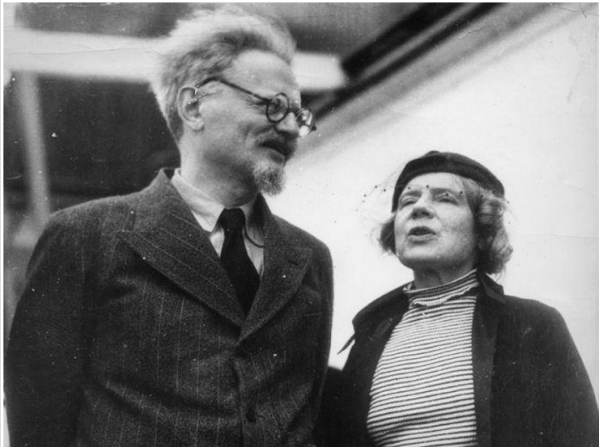
Leo Trotskij med sin hustru Natalja Sedova Trotskij i Mexiko 1938.