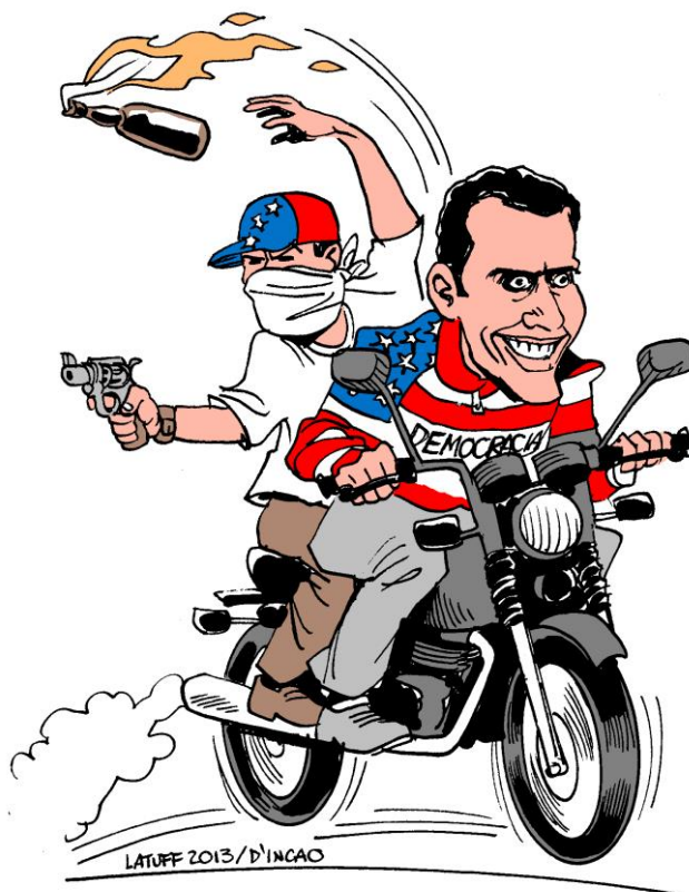
Capriles demokrati – Oppositionen i Venezuela

Det är frestande att fråga sig hur Chávez skulle ha svarat på krisen om han hade levt några år till. Maduro har varit anmärkningsvärt passiv sedan han tog över. Han är uppenbart motvillig att ta tag i de brännande frågorna med nödvändiga reformer. Många observatörer tror att han är ovillig att utmana korruperade egenintressen inom ”bolibourgeoisien”, som gör stora profiter på det nuvarande upplägget. Det är lätt att helt enkelt ställa Chávez’ förtjänster mot hans efterträdares svagheter: Maduro har dock ställts inför ett helt annat sammanhang och hans problem uppstod inte över en natt. Men det är svårt att tänka sig att Chávez skulle ha uppvisat samma försagdhet inför den uppenbara katastrofen.