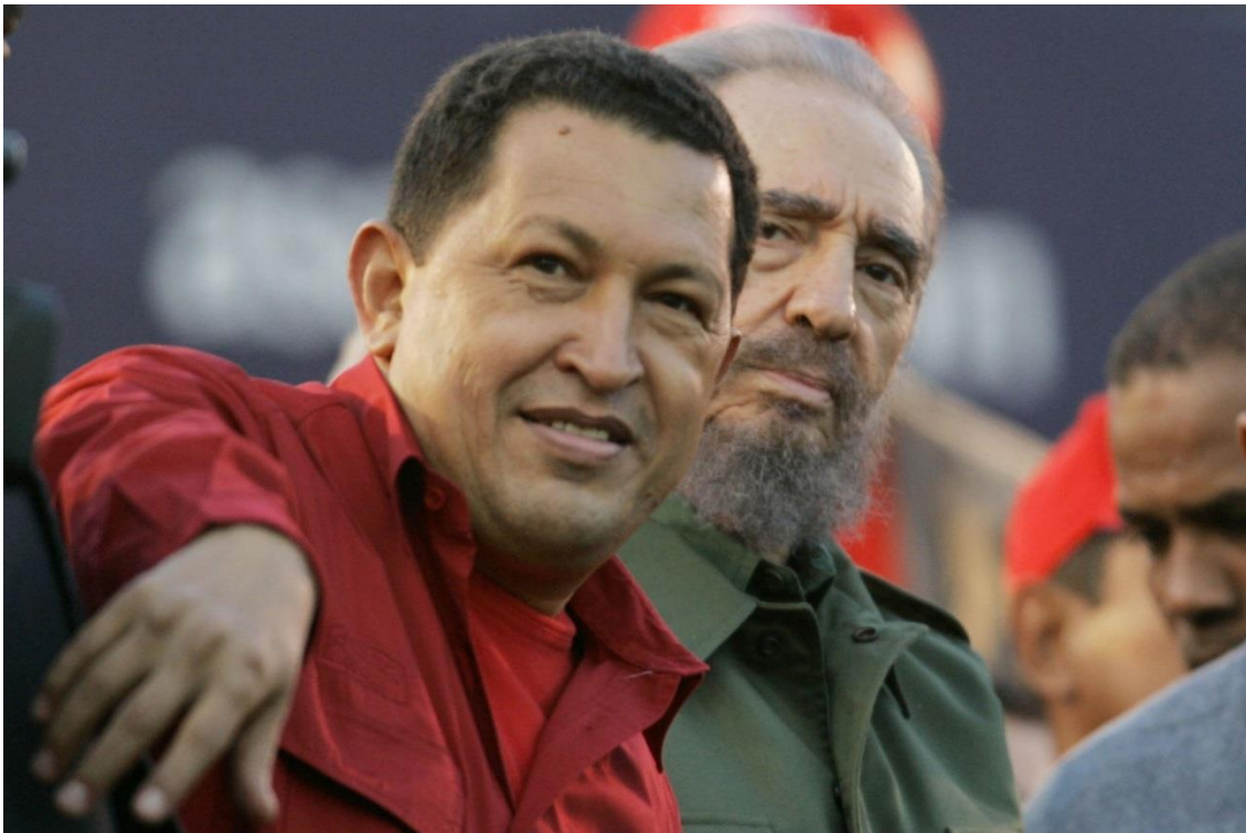
Chávez och Castro – två numera avlidna latinamerikanska vänsterledare

En ny konstitution gav medborgarna större utrymme att hålla sina förtroendevälda ansvariga genom rätten att återkalla alla offentliga befattningshavare (oppositionspartierna utnyttjade detta med den för dem misslyckade folkomröstningen 2004).