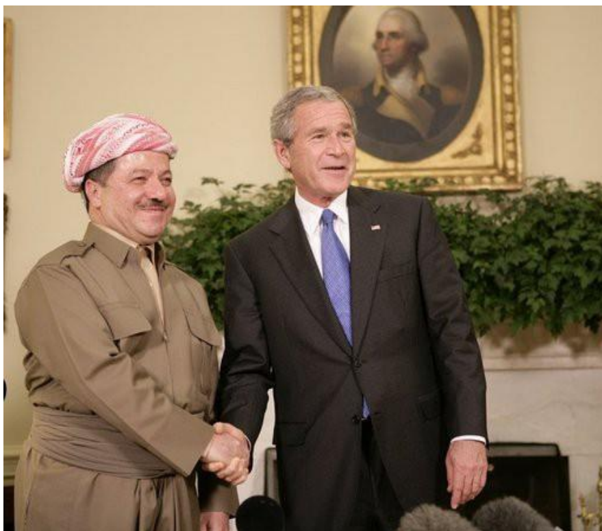
Barzani och president Bush

Därmed har Irak enligt premiärministern Haider al-Abadi förklarat den kurdiska folkomröstningen, där 93 procent av de 70 procent som deltog röstade ja till en egen stat, vara "en sak i det förgångna" som regeringen i Bagdad vägrar förhandla om. Samma dag gav de kurdiska peshmergastyrkorna även upp kontrollen över den viktiga kurdisk-turkiska gränsposteringen Fishkabur, där de pipelines passerar som tar oljeexporten till Ceyhan i Turkiet.