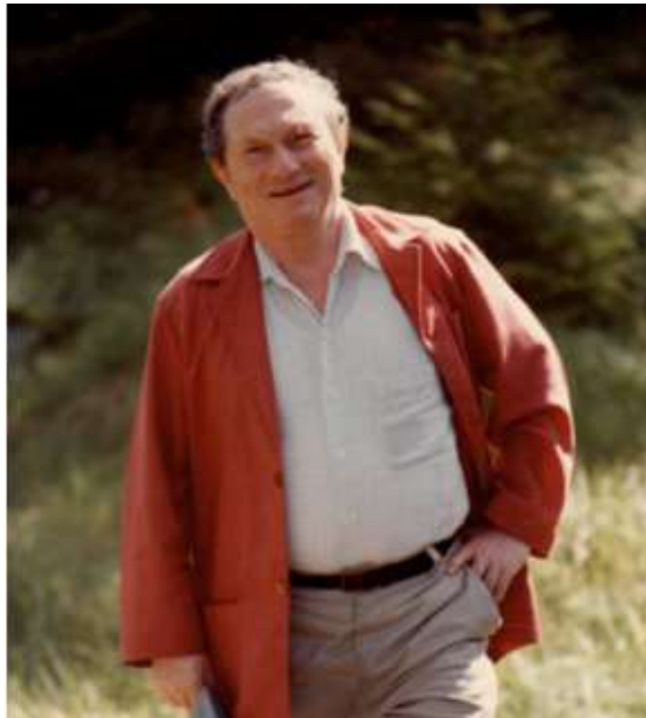
Moshe Lewin 1921 - 2010.

Moshe Lewin har skrivit en mycket faktpäckad och initierad analys av bolsjevikernas förhållande till bönderna under NEP-periodens sista del; från 1928 till tvångskollektiviseringarna 1929 - 1930. Mer specifikt handlar det om hur Ryssland/Sovjetunionen skulle industrialiseras och hur det skall införas ett utökat samarbete med och mellan bönderna på landsbygden.