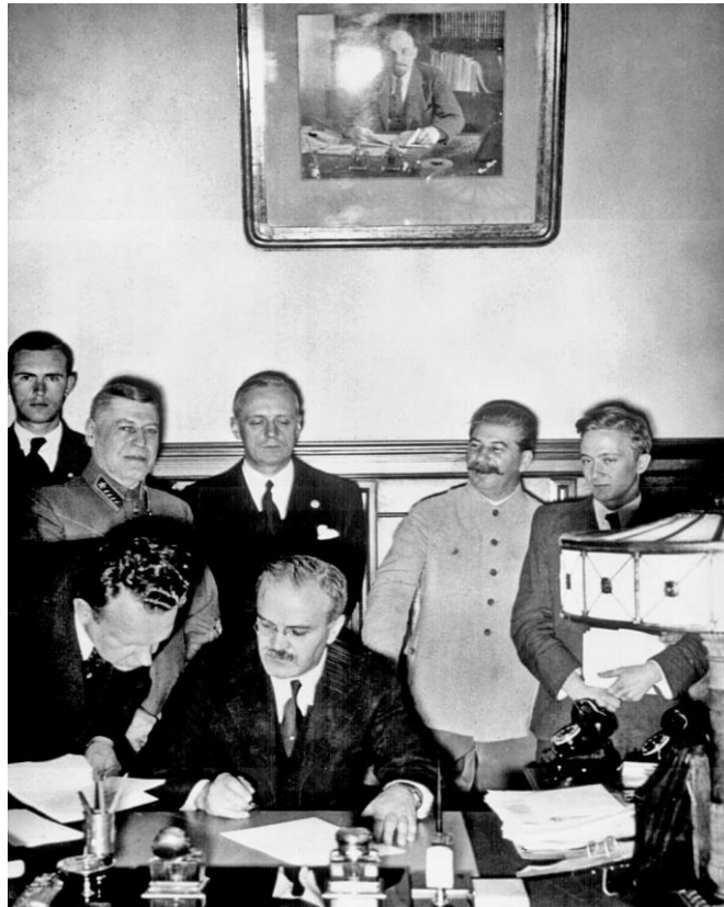
Molotov undertecknar paktens. Bakom honom von Ribbentrop och Stalin

Efter några veckors förvirrade försök att sitta på båda stolarna – att både mana till kamp mot Hitler och försvara Stalins pakt med honom – föll kommunistpartiernas ledare in i ledet och började fördöma det ”orättfärdiga imperialistiska kriget” och jämställa de krigförande parterna – om inte rent av urskulda Hitlers ansvar – i fullständig kontrast till sin tidigare hållning där nazi-regimen utpekats som en av de främsta krigshetsarna.