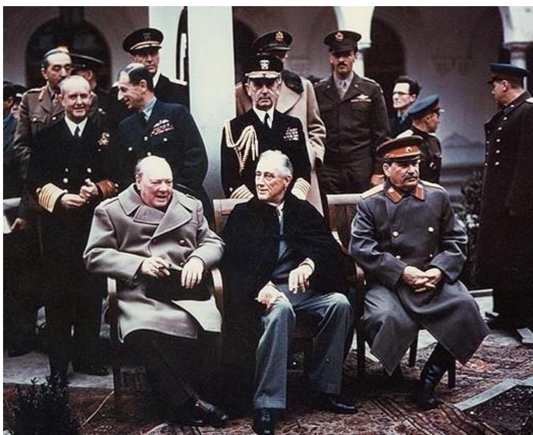
Churchill, Roosevelt och Stalin vid Jalta-konferensen i februari 1945