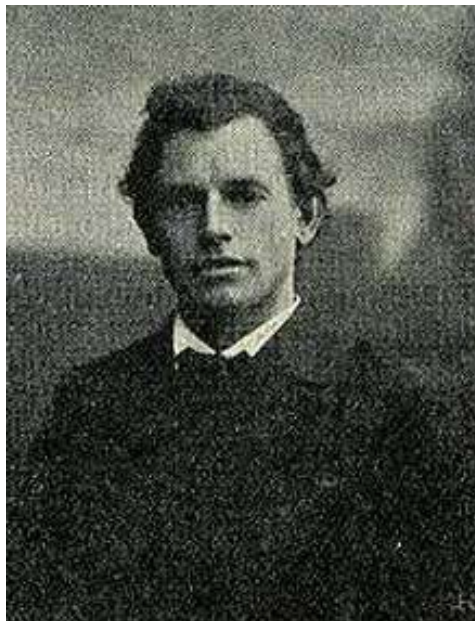
En ung Martin Andersen.

Nexö växte upp i fattigkvarteren i Köpenhamn. Han utbildade sig till lärare, och närde tidigt drömmen om att bli författare. Den första utgivningen blev en novellsamling om öden och liv på Bornholm. Året var 1898. Han var då även bosatt på Bornholm.