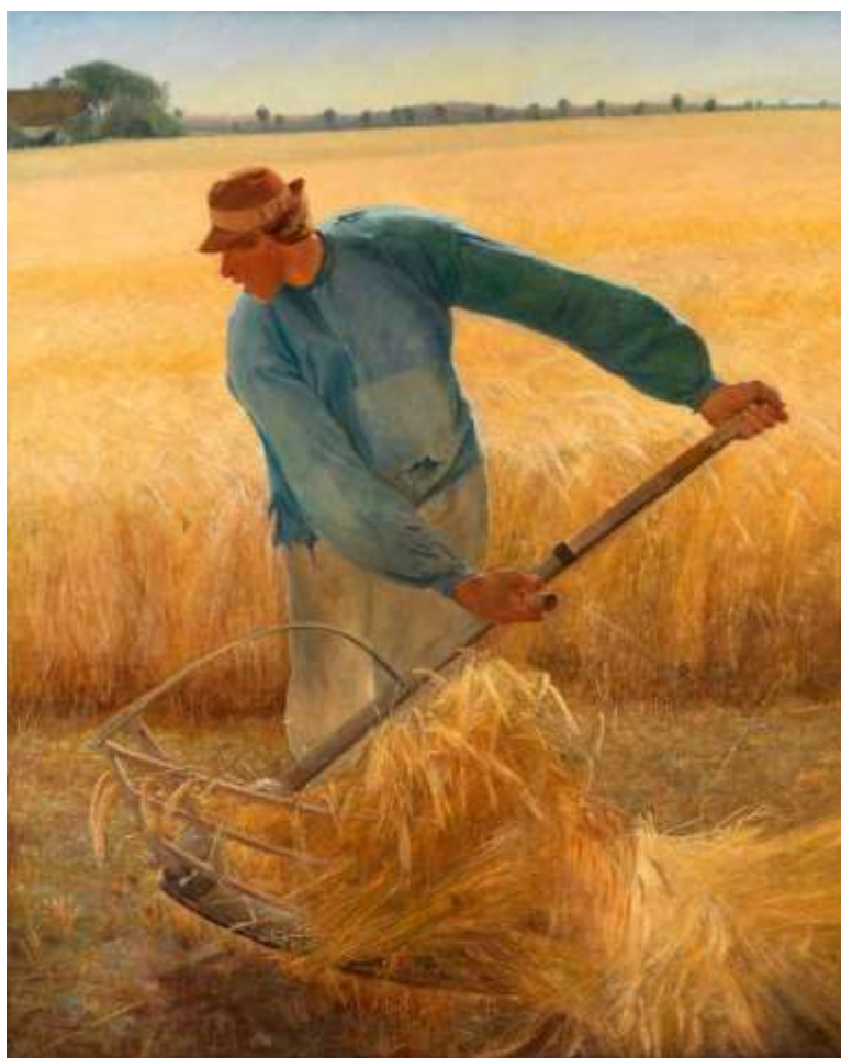
Lauritz Andersen Ring: Lantarbetare.