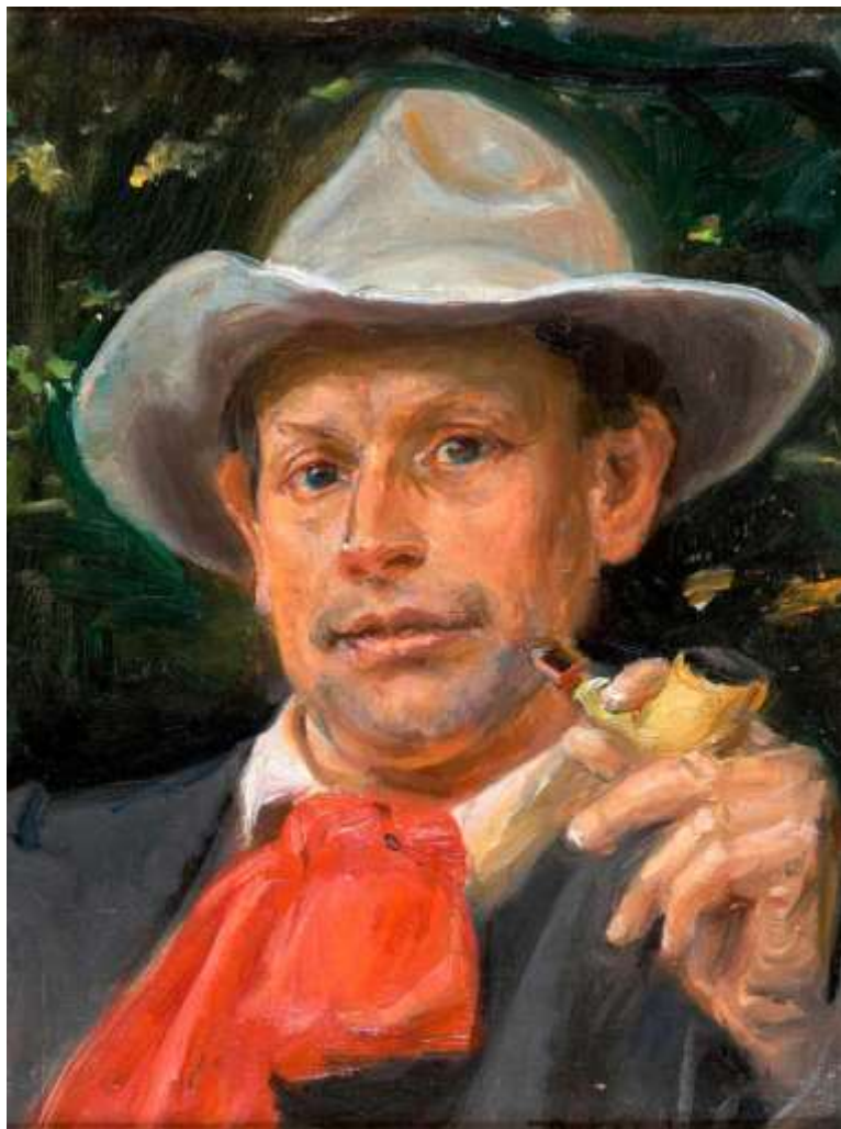
Michael Anchers porträtt av den unge Nexö från 1911.

De litterära verk – som ändå till syvende och sist är huvudorsaken till att vi intresserar oss för Nexö, Johnson, Martinson, Lo-Johansson och co. – står kvar i tystnaden. Den osläckbara fascination som skapas av ett mångsidigt mästerverk som Pelle Erövraren , framkommer bara indirekt, som ett mystiskt x , bara anat genom de reaktioner som det framkallat.