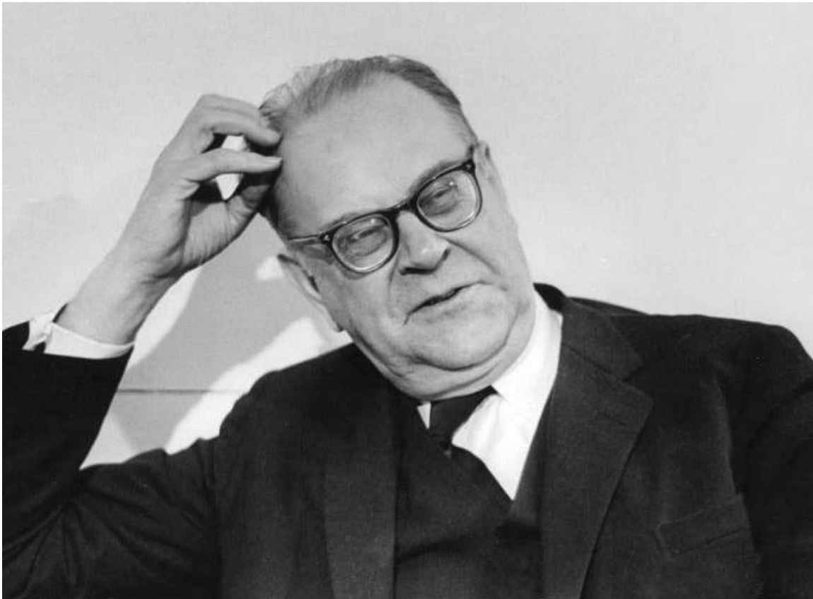
Är Tage Erlander (1901-85) verkligen rätt förebild för dagens vänster?

Bör ”den svenska modellen” och Tage Erlanders 1 socialdemokrati bli vänsterns nya föredöme? Samtidshistorikern Kjell Östberg granskar kritiskt ett begrepp och en epok som ofta missförstås.